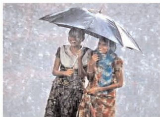
है. १६ जून के बाद इसमें तेजी आने की संभावना है. झारखंड में मॉनसून १९ जून के आसपास आने की संभावना है. झारखंड में