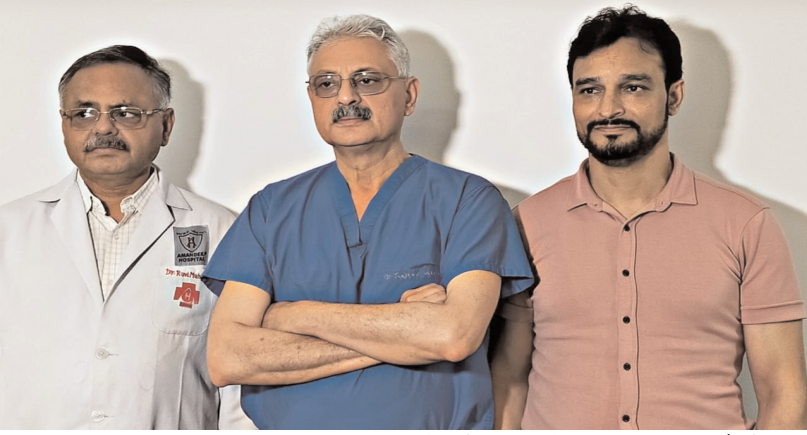
दैनिक केसरिया हिन्दुस्तान कुलदीप कुमार ब्यूरो