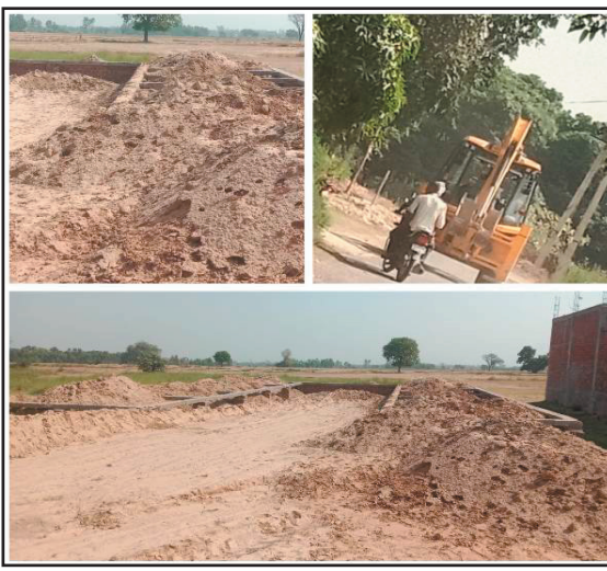
से मिली जानकारी के अनुसार एक दिन मशीन चलाने वालों का कहना है की हम लगभग 220000 रोज का देते है हमारा कोई क्या कर