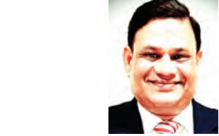
डॉ. अशोक कुमार भागवत