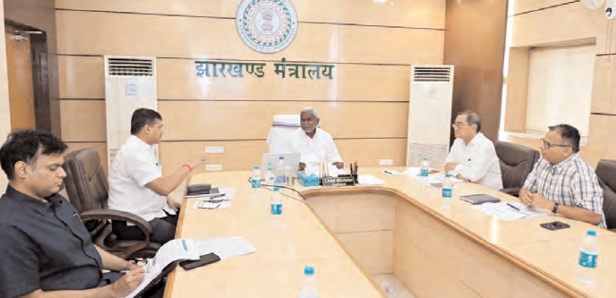
ट्राइबल यूनिवर्सिटी को जल्द बनाएं क्रियाशील

मुख्यमंत्री ने शुक्रवार को झारखंड मंत्रालय में उच्च एवं तकनीकी शिक्षा विभाग विभाग की उच्च स्तरीय बैठक की। उन्होंने गुरुजी स्टूडेंट क्रेडिट कार्ड योजना के 'गो लाइव ऑफ स्टूडेंट एप्लीकेशन मॉड्यूल' का शुभारंभ किया। इसके तहत जिन विद्यार्थियों का चयन उच्च शिक्षण संस्थान के लिए हो चुका है, वे ऑनलाइन आवेदन कर सकेंगे। इसके बाद उन्हें सरकार द्वारा इस योजना के लिए जिन बैंकों के साथ