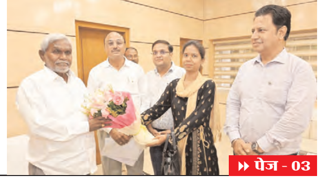
▶▶ पेज - 03

हम बनेंगे आपकी आवाज, निर्भीक एवं निष्पक्ष हिन्दी दैनिक