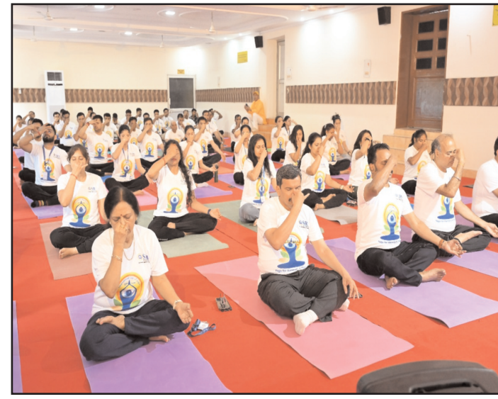
और मानसिकता के द्वारा सामूहिक कल्याण पर कैसे सकारात्मक प्रभाव डाल सकते हैं, इस पर विचार करने की अपील की। इसने योग का महत्व बताया

योग अभ्यासों के माध्यम से कुशलतापूर्वक मार्गदर्शन किया। प्रतिभागियों ने पूरे मन से योगासन, मुद्रा, ध्यान और प्राणायाम में भाग लिया, और प्रत्येक अभ्यास के लाभों का प्रत्यक्ष अनुभव किया। पूरे सत्र के दौरान, कार्यक्रम की थीम, "स्वयं और समाज के लिए योग" पर जोर दिया गया, जिसमें योग के समग्र दृष्टिकोण पर प्रकाश डाला गया जो न केवल व्यक्तियों को लाभ पहुंचाता है बल्कि समाज की बेहतरी में भी योगदान देता है। इवेंट का उद्देश्य व्यक्तियों और समाज के बीच की आपसी आवश्यकता को जोर देना था, जिससे उपस्थित लोगों को अपने व्यक्तिगत कल्याण को ही महत्व देने के साथ-साथ अपने आचरण