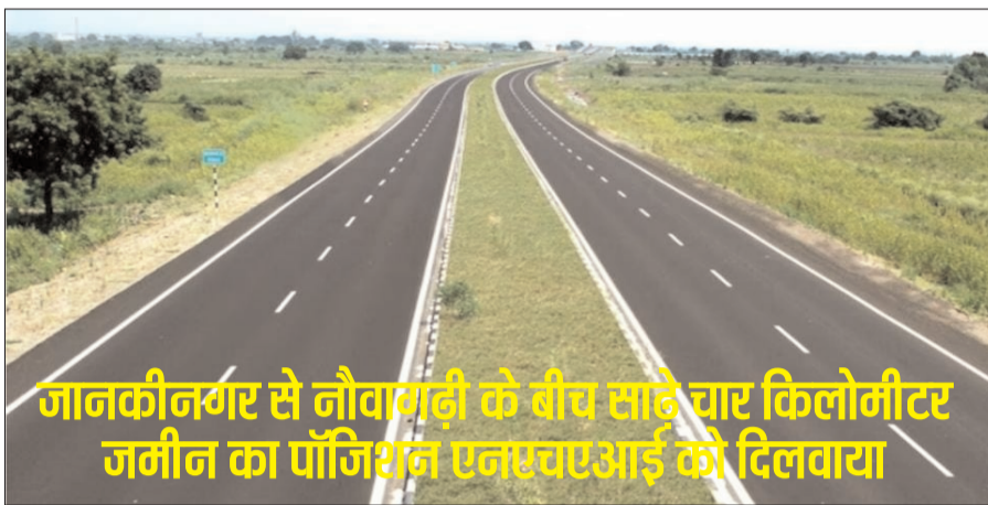
जानकीनगर से नौवागढ़ी के बीच साढ़े चार किलोमीटर जमीन का पॉजिशन एनएचएआई को दिलाया

मुंगेर-मिर्जाचौकी फोरलेन निर्माण का कार्य दूर हुआ : मुंगेर-मिर्जाचौकी फोरलेन निर्माण के लिए अधिग्रहित भूमि पर जिला प्रशासन ने जानकीनगर से नौवागढ़ी के बीच साढ़े चार किलोमीटर जमीन का पॉजिशन एनएचएआई को दिलाया है. इसे लेकर कई बार रैयत और प्रशासन आमने-सामने हुआ, लेकिन प्रशासन की सख्ती के बीच रैयतों को पीछे हटना पड़ा. गुरुवार को शेष बचे डेढ़ किलोमीटर जमीन पर पॉजिशन दिलाने का काम किया जायेगा. तैयारी के साथ पहुंची जिला व पुलिस प्रशासन ने दिलाया पॉजिशन. बताया जाता है कि जानकी नगर से नौवागढ़ी के बीच फोरलेन निर्माण