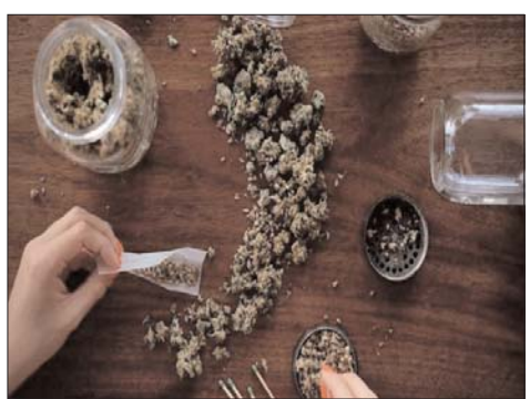
करोड़ लोग कोकेन की लत का शिकार हैं।

नई दिल्ली। दुनिया भर में नशा करने वालों की संख्या में 20 फीसदी की बढ़ोतरी दर्ज की जा रही है। संयुक्त राष्ट्र संघ (यूएन) कार्यालय की रिपोर्ट के मुताबिक विश्व में नशा करने वालों की संख्या 29.2 करोड़ पहुंच गई है। इसमें सबसे ज्यादा 22.8 करोड़ लोग भांग का सेवन करते हैं। यूएन कार्यालय द्वारा जारी रिपोर्ट के मुताबिक 2022 को समाप्त हुए दशक में, अवैध मादक पदार्थों का उपयोग करने वालों की संख्या बढ़कर 29.2 करोड़ पहुंच गई है। दुनियाभर में मादक पदार्थों का सेवन करने वाले अधिकतर लोग यानि 22.8 करोड़ लोग कैनेबिस (भांग) का सेवन करते हैं। इसके बाद अफीम युक्त दवाओं का सेवन करने वाले लोगों की संख्या छह करोड़ है, मेथामफेटामीन का सेवन करने वाले 03 करोड़ लोग हैं, जबकि 2.3