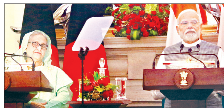
बांग्लादेश की प्रधानमंत्री ने राष्ट्रपति से की मुलाकात

प्रधानमंत्री शेख हसीना ने राजघाट जाकर महात्मा गांधी को श्रद्धांजलि भी अर्पित की। बांग्लादेश की पीएम का राष्ट्रपति द्रौपदी मुर्मू और उपराष्ट्रपति जगदीप धनखड़ से भी मुलाकात करने का कार्यक्रम है। शेख हसीना उन अंतरराष्ट्रीय नेताओं में शामिल थीं, जिन्होंने इस महीने की शुरुआत में 9 जून को पीएम मोदी और केंद्रीय मंत्रिपरिषद के शपथ ग्रहण समारोह में हिस्सा लिया था।