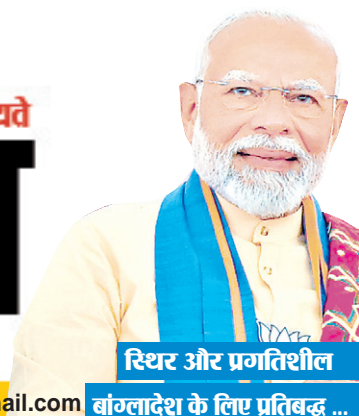
रिश्त और प्रगतिशील