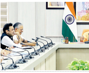
मैटिंग्स के कारण अगर बिजली कटती की जाती है तो कब और कितनी देर तक विद्युत आपूर्ति बाधित रहेगी, इसकी पूर्व सूचना उपभोक्ताओं को देना अच्छी है। इसके लिए सोशल मीडिया का न्यादा से न्यादा उपयोग करें

एजेंसी। लखनऊ। मुख्यमंत्री योगी आदित्यनाथ ने शनिवार को ऊर्जा विभाग की महत्वपूर्ण बैठक ली। इस दौरान उन्होंने विभाग की ओर से प्रस्तुत किये गये प्रजेंटेशन का अवलोकन किया। सीएम योगी ने कहा कि बिजली का बिल समय से जमा कराने के लिए लोगों में जागरूकता बढ़ाना का कार्य करना अत्यंत जरूरी है। उन्होंने कहा कि जिस प्रकार लोग मोबाइल का बिल नियत समय पर जमा करते हैं, उसी प्रकार बिजली का बिल भी तय समय पर जमा कराने के लिए उन्हें प्रोत्साहित किया जाए। इसके लिए विभाग एक सुदृढ़ मैकेनिज्म तैयार करे। सीएम योगी ने प्रदेश में स्मार्ट मीटर लगाने पर विशेष जोर दिया और कहा कि जनता को इसके लिए तैयार किया जाए। स्मार्ट मीटर