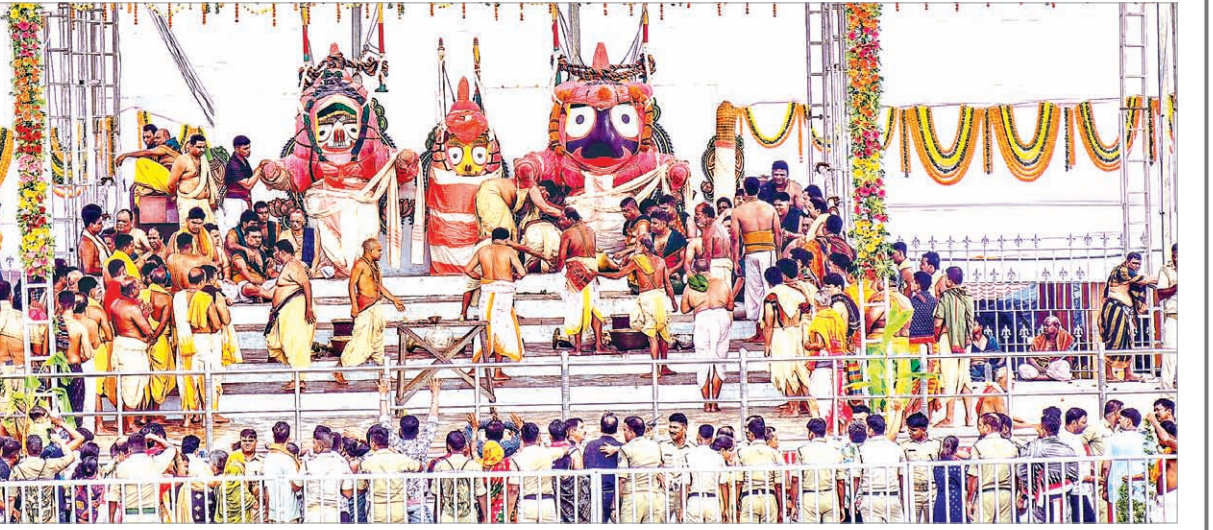
पुरी। भगवान जगन्नाथ मंदिर की चतुर्था मूर्ति (भगवान जगन्नाथ, भगवान बलभद्र, देवी सुभद्रा और सुदर्शन) की प्रतिमाएं देवा स्नान पूर्णिमा के अवसर पर भव्य स्नान अनुष्ठान के लिए स्नान मंडप में

एनटीए में सुधार करने के लिए उठाए गए कदमों की श्रृंखला में पहला कदम है। छात्र हित और उनका उज्वल भविष्य हमेशा हमारी परीक्षाओं के संचालन की निगरानी के लिए गठित विशेषज्ञ समिति को पारदर्शी बनाने, सुचारु और निष्पक्ष संचालन सुनिश्चित करने के लिए सात विशेषज्ञों की एक उच्च स्तरीय समिति का गठन किया है। यह समिति दो महीने के भीतर मंत्रालय को अपनी रिपोर्ट सौंपेगी। विशेषज्ञ पैनल के गठन का कदम राष्ट्रीय पाठ्यसह प्रवेश परीक्षा (नीट) परीक्षा और शून्य त्रुटि परीक्षाएं एक प्रतिबद्धता है। उद्योग जगत से व्यापक परामर्श की प्रक्रिया जल्द शुरू होने वाली है। मंत्री ने जोर देकर कहा कि प्रधानमंत्री नरेंद्र मोदी के तीसरे