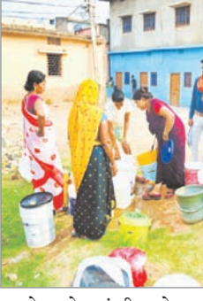
से हमारे यहां भीषण पेयजल संकट उत्पन्न हो गया