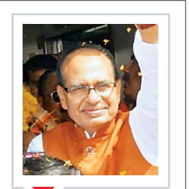
केंद्रीय कृषि मंत्री बनने के बाद पहली बार मध्य प्रदेश आए शिवराज, मुरैना स्टेशन पर भव्य स्वागत

एजेसी मुरैना। केंद्रीय कृषि एवं किसान कल्याण तथा ग्रामीण विकास पंचायत राज मंत्री शिवराज सिंह चौहान ने कृषि को भारतीय अर्थव्यवस्था की रीढ़ बतते हुए कहा कि किसान हमारा भगवान है और किसान की सेवा भगवान की सेवा है। कृषि एवं किसान कल्याण के लिए 100 दिन की कार्य योजना तैयार कर ली गई है। प्रधानमंत्री नरेन्द्र मोदी के नेतृत्व में तीसरी बार सरकार बनने पर सबसे पहले 18 जून को काशी से किसानों को सम्मान निधि की राशि प्रदान की जाएगी। प्रधानमंत्री मोदी सिंगल क्लिक के माध्यम से इस राशि को हस्तांतरित करेंगे। सरकार किसान कल्याण के लिए कोई कमी नहीं छोड़ेगी। केंद्रीय कृषि मंत्री रविवार को मुरैना रेलवे स्टेशन पर मीडिया से बातचीत कर रहे थे। केंद्र सरकार में शामिल होने के बाद शिवराज सिंह चौहान पहली बार मध्य प्रदेश आए हैं। रविवार सुबह शताब्दी एक्सप्रेस से मुरैना पहुंचे शिवराज सिंह चौहान का कार्यक्रमों ने मुरैना रेलवे स्टेशन पर भव्य स्वागत किया। इस दौरान उन्होंने कहा कि विगत 10 वर्षों में प्रधानमंत्री नरेन्द्र मोदी के नेतृत्व में किसान कल्याण के लिए अद्भुत व अभूतपूर्व