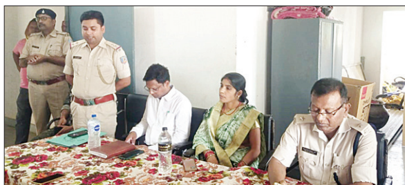
असामाजिक तत्वों पर पुलिस की नजर रहेगी