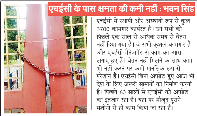
एचईसी की क्षमता

नवीन मेल संवाददाता। रांची बकाया वेतन को लेकर एचईसी के स्थायी कर्मचारी पिछले एक साल दस महीनों से आंदोलनरत हैं। लेकिन, वेतन का भुगतान अब तक नहीं हुआ है, और ना ही प्रबंधन की ओर से इस संबंध में कोई पहल की गई है। 1180 स्थायी कामगारों ने सोमवार को एचईसी के निदेशक (कार्मिक) और निदेशक (उत्पादन) का घेराव करते हुए संचालित तीन प्लांटों में टूल डाउन का एलान किया। काम नहीं होने से एचईसी को प्रत्येक दिन करोड़ों रुपये का नुकसान हो रहा है। कामगारों ने अधिकारियों से वेतन के संबंध में एक निश्चित तिथि की घोषणा करने को कहा है। रक्षा राज्य मंत्री बने संजय सेठ के विभाग का लगभग 200 करोड़ रुपये का डिफेंस का अकांक्षा प्रोजेक्ट एचईसी के पास पड़ा हुआ है। एचईसी को अभी बेलआउट पैकेज की जरूरत है। ऐसे में वहां के कामगारों को फिलहाल सांसद संजय सेठ से कार्पी उम्मीदें बनी हुई हैं। बता दें कि कार्यशील पूंजी की कमी के कारण यह समस्या उत्पन्न हुई है। क्योंकि, जो खर्च बैंक, बिजली, पानी आदि का है, वे सब दिव्य जाते हैं। केवल कार्यशील पूंजी की जरूरत है। वर्तमान में एचईसी के पास 1000 करोड़ का काम आया हुआ है।