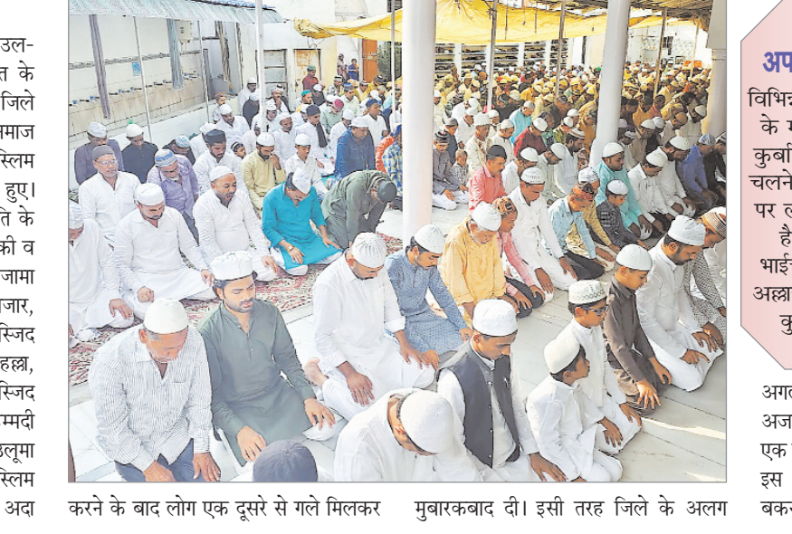
करने के बाद लोग एक दूसरे से गले मिलकर मुबारकबाद दी। इसी तरह जिले के अलग

नवीन मेल संवाददाता मेदिनीनगर। जिले में सोमवार को ईद-उल-अजहा (बकरीद) का त्योहार अकीदत के साथ मनायी गयी। सुबह 8.30 बजे से जिले के विभिन्न क्षेत्र के मस्जिदों पर विशेष नमाज अदा की गई। हजार की संख्या में मुस्लिम समुदाय के लोग विशेष नमाज में शामिल हुए। इस दौरान प्रदेश, देश में अमन चैन शांति के लिए मुस्लिम समुदाय ने सामूहिक दुआ की व भाईचारे का संदेश दिया। शहरी क्षेत्र के जामा मस्जिद छहमहान, छोटी मस्जिद मेन बाजार, नूरी मस्जिद पहाड़ी मुहल्ला, मदीना मस्जिद मुहल्लमनगर, मिल्लत मस्जिद कुंड मुहल्ला, मस्जिद ए हे राईन मुहल्ला, अलकसीम मस्जिद नावाटोली, अहले हदीस मस्जिद, मोहम्मदी मस्जिद मुस्लिमनगर, मद्रसा अहसानुल उलूम शाह मुहल्ला में निर्धारित समय पर मुस्लिम समाज के लोगों ने नमाज अदा की। नमाज अदा