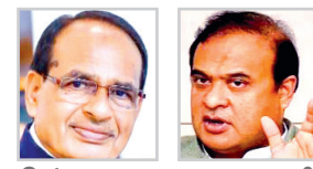
हिमंता सरगमा बनाए गए सह प्रभारी

शिवराज सिंह बने झारखंड विधानसभा चुनाव के प्रभारी