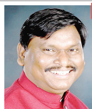
सोशल मीडिया पर खूब हो रही है समीक्षा बैठक की चर्चा

नवीन मेल संवाददाता। रांची लोकसभा चुनाव में राज्य की सभी पांचों आदिवासी आरक्षित सीट पर भाजपा की करारी हार के बाद पार्टी के अंदर कोहराम मचा है। भाजपा को सबसे बड़ा आघात खूटी लोकसभा सीट पर लगा है, जहां से पार्टी के सबसे बड़े आदिवासी चेहरा और पूर्व केंद्रीय जनजातीय मंत्री अर्जुन मुंडा चुनाव हार गए। उन्हें कांग्रेस के कालीचरण मुंडा ने डेढ़ लाख से भी अधिक मतों से हराया। इस हार के बाद पार्टी ने समीक्षा बैठक की, जिसमें हार के कारणों का जानने का प्रयास किया गया। खूटी लोकसभा क्षेत्र में पडने वाले सभी छह विधायक क्षेत्र तोरपा, खूटी, सिमडेगा, कोलेबिरा, तमाड और खरसावां के प्रमुख भाजपा कार्यकर्ताओं को बैठक में बुलाया गया था। समीक्षा बैठक में नेता-कार्यकर्ता एक-दूसरे पर ही आरोप