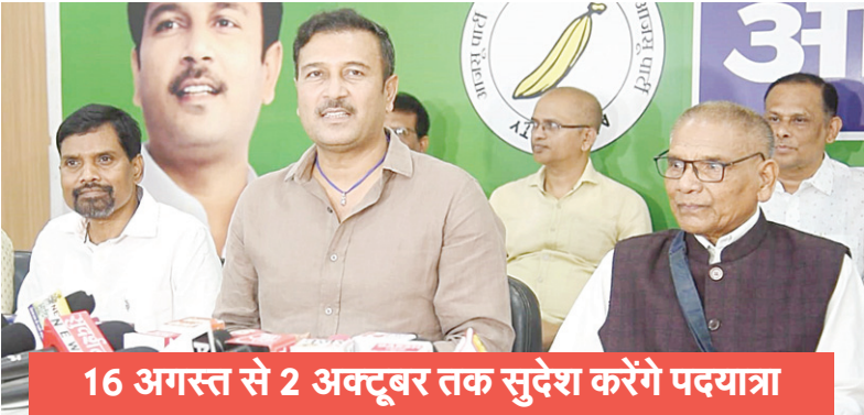
16 अगस्त से 2 अक्टूबर तक सुदेश करेंगे पदयात्रा