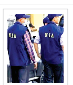
प्रधानमंत्री नरेंद्र मोदी ने भी 13 जून को जम्मू-कश्मीर में सुरक्षा स्थिति की समीक्षा की थी

नई दिल्ली। केंद्रीय गृह मंत्रालय ने जम्मू-कश्मीर में हाल ही में एक यात्री बस पर हुए आतंकी हमले की जांच राष्ट्रीय जांच एजेंसी (एनआईए) को सौंप दी है। एनआईए द्वारा आज सोमवार (17 जून) ने यह बयान जारी किया है। एनआईए के एक अधिकारी के मुताबिक जम्मू-कश्मीर में 9 जून को एक यात्री बस पर हुए आतंकी हमले की जांच एनआईए को सौंप दी गई है। यह फैसला केंद्रीय गृह मंत्री अमित शाह द्वारा लगातार दो बैठकों में जम्मू-कश्मीर में सुरक्षा स्थिति और वार्षिक अमरनाथ यात्रा की तैयारियों की समीक्षा के एक दिन बाद लिया गया। ये बैठकें रियासी जिले में बस पर हुए आतंकी हमले और केंद्र शासित प्रदेश में कुछ अन्य आतंकी घटनाओं के मद्देनजर बुलाई गई थीं।