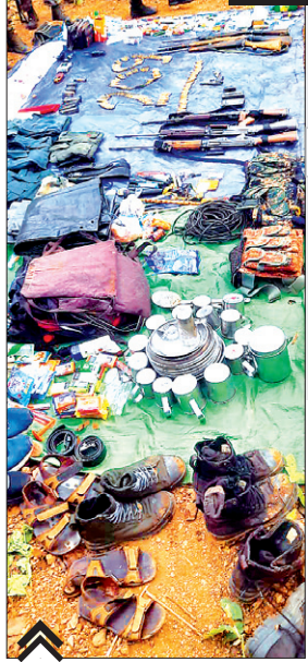
नक्सलियों के पास से बरामद हथियार, गोला व अन्य सामग्री।