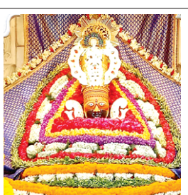
श्री सुंदरकांड श्री हनुमान चालीसा पाठ आज