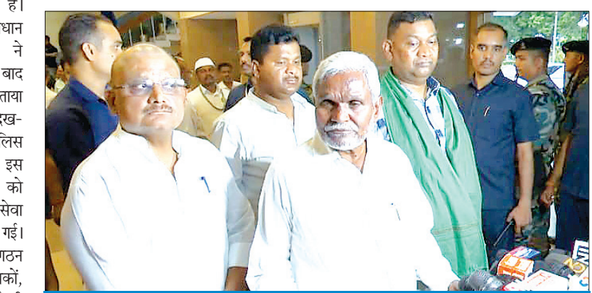
झारखंड वरीय न्यायिक सेवा नियमावली में संशोधन

सचेतक का वेतन भत्ता : मुख्य सचेतक को 75000 प्रतिमाह उप सचेतक को 70000 रुपये प्रतिमाह सचेतक को 60000 प्रतिमाह मिलेगा। इन्हें सत्कार भत्ता 55000, क्षेत्रीय भत्ता 65000, प्रभारी भत्ता 3000, राज्य के अंदर 4000, राज्य के बाहर लगभग एक लाख रुपये प्रतिमाह। कंप्यूटर की सुविधा 1,00,000 तक और होम लोन 60 लाख तक मिलेगा।