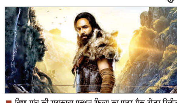
विष्णु मांचू की महाकाव्य एक्शन फिल्म का पावर-पैक टीजर रिलीज

फिल्म फेस्टिवल में प्रतिष्ठा हासिल करने और अपने प्रतिष्ठित प्रदर्शन के बाद, महाकाव्य एक्शन फिल्म 'कन्नप्पा' का बहुप्रतीक्षित टीजर अब रिलीज के लिए पूरी तरह तैयार है। आखिरकार, वह समय आ ही गया, जब दुनियाभर के दर्शकों को विष्णु मांचू के ड्रीम प्रोजेक्ट की शानदार झलक देखने को मिलेगी। 'कन्नप्पा' में विष्णु मांचू ने भक्त कन्नप्पा की भूमिका निभायी है। इसके अतिरिक्त, मोहन बाबू, मोहनलाल, प्रभास, अक्षय कुमार, शरथ कुमार और काजल अग्रवाल के साथ ही विभिन्न प्रभावशाली कलाकार भी इस फिल्म का हिस्सा हैं। इस फिल्म का निर्देशन मुकेश कुमार सिंह ने किया है। 'कन्नप्पा' भक्ति और बलिदान की पौराणिक कहानी को जीवंत करने वाली एक