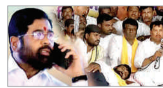
मुख्यमंत्री एकनाथ शिंदे ने गुरुवार को भरोसा दिलाया है कि महाराष्ट्र सरकार ओबीसी आरक्षण को किसी भी कीमत पर नुकसान नहीं होने देगी।