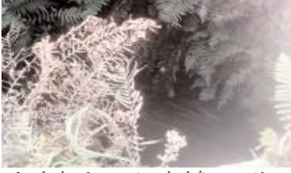
ग्रामीण। क्षेत्र के अधिकतर कुएं सूखे पड़े हैं, एक कुआं जिसका

कान्हाचट्टी (चतरा)। कान्हाचट्टी प्रखंड अंतर्गत तुलबुल पंचायत के विभिन्न गांव में इस भीषण गर्मी के साथ विभागीय उदासीनता का दस झेल रहे हैं