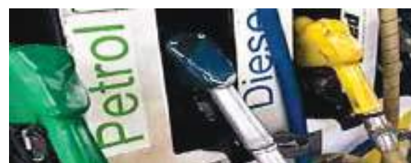
नवी दिल्ली। एग्नेली

अंतरराष्ट्रीय स्तर पर कच्चे तेल की कीमतों में उतार चढ़ाव के बीच घरेलू स्तर पर पेट्रोल और डीजल के दाम में आज टिकाव रहा, जिससे दिल्ली में पेट्रोल 94.72 रुपये प्रति लीटर तथा डीजल 87.62 रुपये प्रति लीटर पर पड़े रहे। तेल विपणन करने वाली प्रमुख कंपनी हिन्दुस्तान पेट्रोलियम कापोरेशन की वेबसाइट पर जारी दरों के अनुसार, देश में आज पेट्रोल और डीजल की कीमतों में कोई बदलाव नहीं हुआ है। दिल्ली