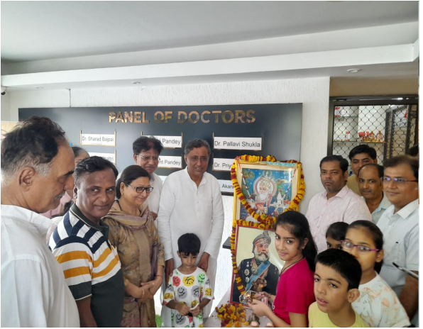
कानपुर। भारतीय सिंधु सभा के तत्वाधान में 'सिन्धु सम्राट महाराजा दहिसेन जी के बलिदान दिवस के अवसर पर स्वरूप नगर स्थित लिटिल चैम्पस किड्स आई केयर सेन्टर में निः शुल्क नेत्र परिक्षण व चश्मा वितरण किया गया।