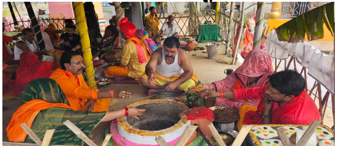
व्यवस्था गांव वालों द्वारा की गयी थी जिसमें बच्चों से लेकर बूढ़े तक शामिल हुये तथा व्यवस्थायें बनाने में सहयोग प्रदान किया।

मटौंधाबेसन में सम्पन्न हुआ था जिसकी पहली वर्षगांठ के उपलक्ष्य में 22 जून से लेकर 24 जून तक अनेक धार्मिक कार्यक्रमों का आयोजन किया गया। 22 जून को भगवान श्रीराम की भव्य शोभायात्रा निकाली तथा 23 जून को विद्वान आचार्यों द्वारा क्षेत्र की खुशहाली हेतु हवन पूजन कराया गया। 24 जून को विशाल भंडारा कराया गया जिसमें गांव ही नहीं बल्कि आसपास के गांवों के भी श्रद्धालु भारी संख्या में शामिल हुये जिन्होंने प्रसाद ग्रहण कर अपने जीवन को धन्य बनाया। 25 जून को भगवान को जल बिहार कराया गया। इस पूरे आयोजन की