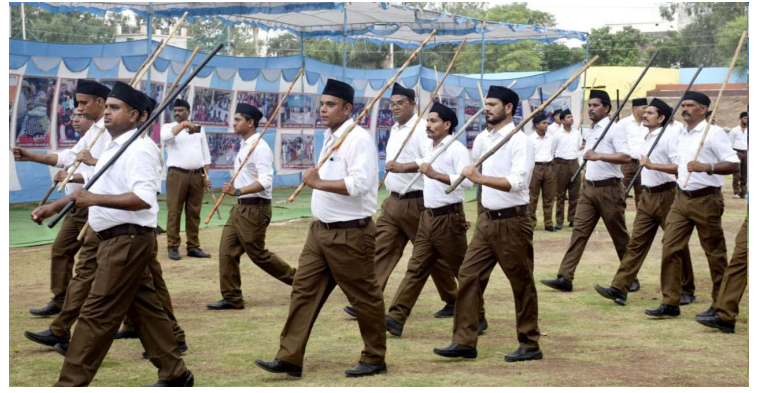
सागर। हिंदू साम्राज्य दिनेत्सव के उपलक्ष में राष्ट्रीय स्वयंसेवक संघ सागर नगर का विशाल पथ संचलन।