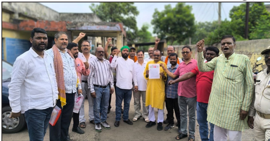
सब किया जा रहा है पूर्व में जब 41 दिन यहां के मजदूरों ने धरना दिया तो बताया गया था कि

कहां की प्रबंधन के मंशा सही नहीं है केवल आउटसोर्सिंग परियोजना चलाने के लिए यह