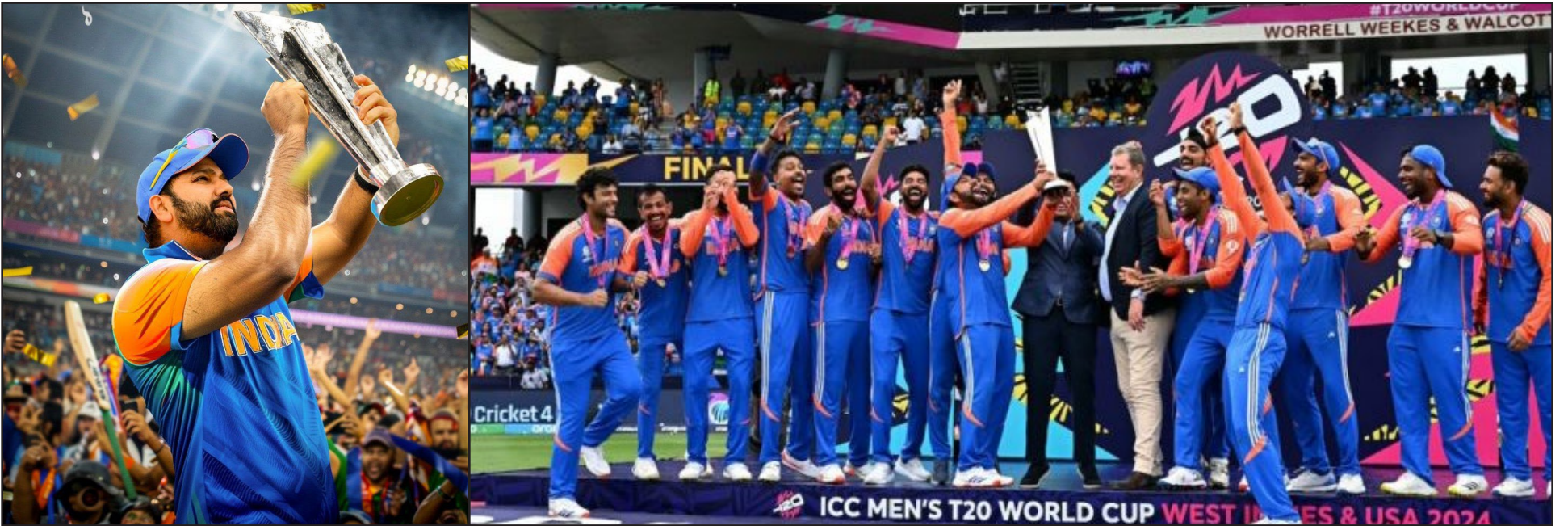
पोलिट लाइव रिपोर्टर

PL न्यूज दिल्ली खेल न्यूज- भारत ने आईसीसी टी20 वर्ल्ड कप के फाइनल में दक्षिण अफ्रीका को हराकर दूसरी बार टी20 विश्व कप का खिताब अपने नाम किया है. भारतीय टीम ने साल 2007 में इससे पहले विश्व कप अपने नाम किया था. भारत की जीत के हीरो विराट कोहली रहे, जिन्होंने 76 रनों की पारी खेली. उन्हें प्लेयर ऑफ द मैच अवॉर्ड दिया गया है. फाइनल का मुकाबला काफी रोमांचक रहा और भारत ने आखिरी गेंद पर मैच अपने नाम किया.