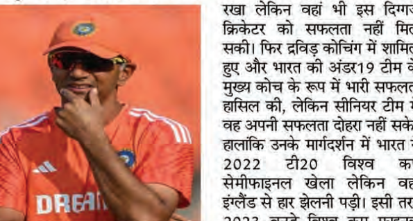
का सबसे महान प्रतिभाओं में से एक हैं और सहवाग चाहते हैं कि रोहित शर्मा की अगुवाई वाली टीम अच्छा प्रदर्शन करे और उन्हें विश्व चैंपियन कहलाने का मौका दे। सहवाग ने कहा कि हमने

टीम में हर किसी को द्रविड़ के सम्मान में ट्रॉफी जीतने के लिए प्रेरित होना चाहिए। वह भारत की अब तक