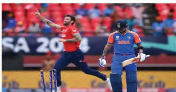
है। हम उनकी क्लास को समझते हैं और इन सभी बड़े मैचों में उनकी अहमियत को समझते हैं। फॉर्म कभी कोई समस्या नहीं होती। जब आप 15 साल तक क्रिकेट खेलते हैं, तो फॉर्म कभी कोई समस्या नहीं होती। वह अच्छा खेल रहे हैं, वह शायद फाइनल के लिए खेल बचा रहे हैं। भारत ने 2022 विश्व कप सेमीफाइनल की यादों को भुलाते हुए इंग्लैंड को 68 रनों से हराकर फाइनल में प्रवेश किया। अक्षर पटेल और कुलदीप यादव की स्पिन जोड़ी ने शानदार प्रदर्शन किया और 172 रनों के लक्ष्य का पीछ करने उतरी इंग्लिश टीम को 16.4 ओवर में

103 रनों पर समेट दिया। अक्षर और कुलदीप दोनों ने 3-3 विकेट लिए। रोहित का मानना है कि फाइनल में विजयी होने का मंत्र अपराजित