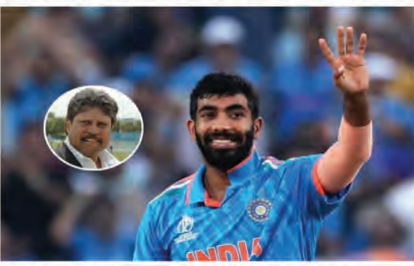
चुके हैं। कपिल ने अपने करियर का समापन 434 टेस्ट विकेट के विश्व रिकॉर्ड के साथ किया था और उन्हें

अब तक के सर्वश्रेष्ठ ऑलराउंडरों में से एक माना जाता है। उन्होंने 253