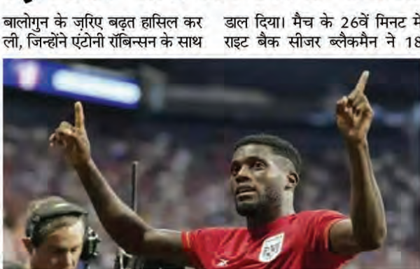
मिलकर बाएं पैर से शॉट मारकर गेंद को ऊपरी-दाएं कोने से गोल पोस्ट में