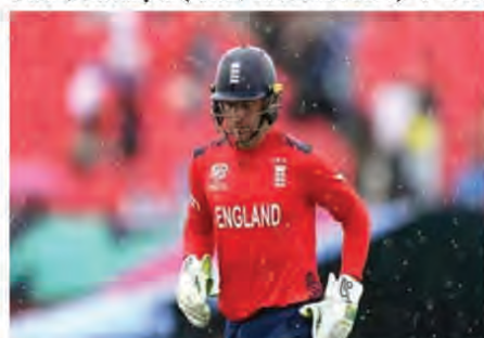
गेंदबाजी की। पीछे मुड़कर देखें तो मोइन को भी इस सतह पर गेंदबाजी करनी चाहिए थी, हम सभी के प्रयास पर वास्तव में गर्व महसूस कर रहे हैं। हम एकजुट रहे, जब सबसे ज्यादा जरूरत थी, तब हमने अच्छा प्रदर्शन किया।

103 रनों पर डेर हो गई। बटलर ने मैच के बाद कहा, हमारे दो खिलाड़ियों (राशिद और लिक्विंस्टोन) ने अच्छी