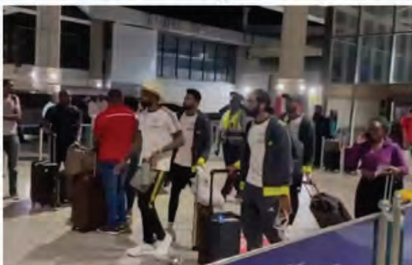
शर्मा की टीम 2013 के चैंपियंस ट्रॉफी के बाद से आईसीसी ट्रॉफी के लिए भारत के सुखे को खत्म करने और दक्षिण अफ्रीका में

एजेंसी ब्रिजटाउन। रोहित शर्मा की अगुवाई वाली टीम इंडिया केसिंटन ओवल में दक्षिण अफ्रीका के खिलाफ टी20 विश्व कप 2024 के फाइनल मैच के लिए शुक्रवार को बारबाडोस पहुंच गई। गुयाना के प्रोविडेंस स्टेडियम में इंग्लैंड को 68 रनों से हराकर भारतीय टीम ने इस बड़े इवेंट के फाइनल में जगह बनाई। वहीं, दक्षिण अफ्रीका ने अफगानिस्तान को नौ विकेट से हराकर फाइनल में अपनी जगह पक्की की। भारतीय टीम ने टी-20 विश्व कप 2024 के रूप चरण में शानदार प्रदर्शन किया और सात अंकों के साथ ग्रुप ए तालिका में शीर्ष पर रही। रोहित