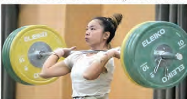
पदक जीतने की संभावना को बढ़ाने के लिए उन्हें 200 किलोग्राम से अधिक वजन उठाने की आवश्यकता होगी। उन्होंने कहा, अब मैं 80 से 85 प्रतिशत (जितना मैं उठाने में सक्षम हूँ) उठा रही हूँ। खेलों में एक महीना बाकी है, मैं धीरे-धीरे अपना वजन बढ़ाऊंगी।

29 वर्षीय भारोत्तोलक, जो उत्साह से लेकर चिंता, तनाव और घबराहट तक के मिश्रित भावों से गुजर रही है, खेलों से पहले प्रशिक्षण के लिए 7 जुलाई को पेरिस के लिए रवाना होने वाली हैं। उन्होंने कहा, पिछले तीन सालों में चोटों के कारण मुझे बहुत कुछ झेलना पड़ा है।