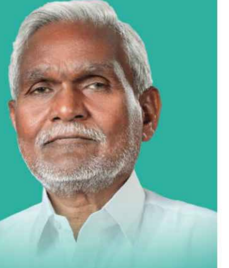
श्री चम्पाई सोरेन मुख्यमंत्री, झारखण्ड