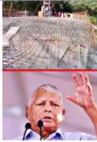
ایسا حادثہ دوسری بار ہوا ہے۔ جس ابھی سوریہ میں انہوں نے پہلے حادثے سے بھی کوئی سبق نہیں سیکھا۔ دریائے جرا نے اپنا رخ بدلا اور کمزور تیزو پانی کے بہاؤ کو برداشت نہیں کر پاتے اور پانی میں غرقاب ہو

نارا میں۔ انہوں نے کہا کہ اگر وقت رہے سرعت کرانی جاتی تو پل کو کرنے سے بچایا جا سکتا تھا۔ 23 جون کو موٹیہاری میں زیر تعمیر پل بھی دوران مرگیا خوش قسمتی تھی کہ کوئی جانی نقصان نہیں ہوا۔ اس حادثے میں بھی لوگ پل کے معیار پر سوال اٹھا رہے ہیں۔ لالو یادو نے تینوں پلوں کے گرنے کی ویدیو موٹیل میڈیا پر پوسٹ کر کے حکومت پر بھی تنبیہ کیا ہے۔ جیہا ڈیل انجمن والی حکومت میں بھی خود کوئی کر رہے ہیں؟ اس سے پہلے تجویزی یادو نے بھی موٹیل میڈیا پر تینوں واقعات کا ذکر کرتے ہوئے کہا کہ پل گر گئے، پہنچائی کھل گئی۔ تجویزی نے فزیری انداز میں یہ بھی کہا کہ ڈیل انجمن والی سرکار اب اپنی صفائی میں کیا ہے؟