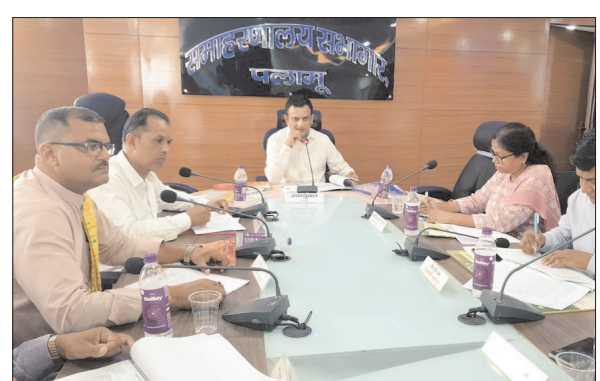
कहा। गाय-बकरी सहित अन्य पशुपालन योजनाओं से जुड़े लाभुकों के साथ-साथ मत्स्य पालकों को केसीसी से लाभान्वित करने की बात कही। उपायुक्त श्री रंजन ने विभिन्न विकास कार्यों के लिए उपलब्ध कराए जा रहे ऋण में सुधार करने का निर्देश दिया। उन्होंने सभी बैंकों से सीडी रेपरो पर विशेष रूप से कार्य करने की बात कही।

मेदिनीनगर (उज्ज्वल दुनिया)। उपायुक्त शशि रंजन की अध्यक्षता में बुधवार को जिला स्तरीय परामर्शदातृ समिति (डीएलसीसी) सह जिला स्तरीय समीक्षा समिति की बैठक हुई। बैठक में उपायुक्त ने मुद्रा ऋण योजना, पीएमईजीपी, केसीसी, स्वयं सहायता समूह, पीएमएसबीवाई, पीएमजेजेबीवाई, एपीवाई, पीएमजेडीवाई, ऋण प्रवाह सहित अन्य योजनाओं की प्रगति की समीक्षा की। समीक्षा के दौरान एलडीएम ने बताया कि पूरे पलामू जिले में मार्च तिमाही में केसीसी लोन 45232 लोगों के बीच 49892 लाख रुपये, पीएमईजीपी के तहत 118 लोगों के बीच 258.95 लाख रुपये सहित कई अन्य योजनाओं के तहत लोन दिया गया है। उन्होंने केसीसी की समीक्षा के क्रम में कृषि क्षेत्र में किसान क्रेडिट कार्ड का लाभ बढाने को