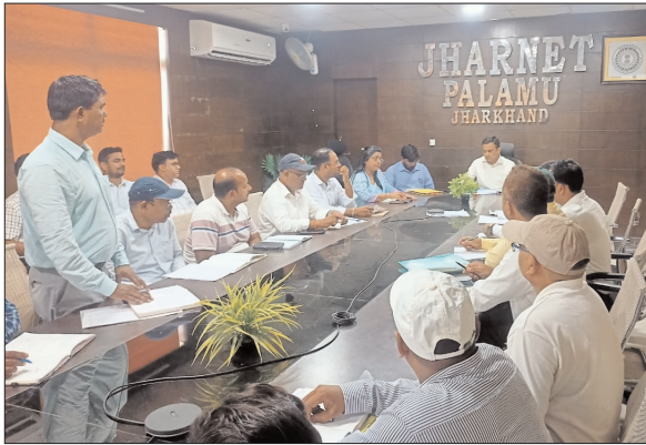
राशनकार्ड तथा सोना-सोबरन धोती साड़ी योजना अंतर्गत वस्तुओं के वितरण के संबंध में सभी प्रखंड आपूर्ति पदाधिकारियों को निर्देश

समीक्षा की गयी, दस दिन के भीतर सभी सहायक गोदाम प्रबंधक को माह जुलाई 2024 तक का खाद्यान्न शत-प्रतिशत डेर स्टेप करने का निर्देश दिया गया। जून और जुलाई माह 2024 का एनएफएसएर के तहत खाद्यान्न वितरण का समीक्षा के दौरान पाया गया कि माह जुलाई 2024 का छतरपुर, मोहम्मदगंज, नावा बाजार, नवडीहा बाजार, प०/वा और पिपरा से एक-एक प्रखंड आपूर्ति पदाधिकारी से बारी-बारी वितरण असंतोष रहने के कारण पूछा गया साथ ही वितरण कार्य में प्रगति लाने का निर्देश दिया गया। माह अप्रैल 2024 का चना दाल, माह अगस्त 2023 का ग्रीन