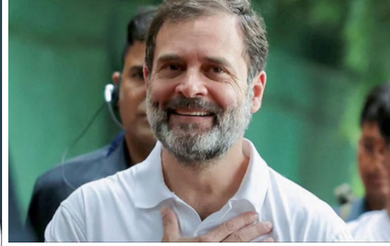
संवाददाता, नई दिल्ली

नई दिल्ली: 18वीं लोकसभा के शुरुआती सत्र के दौरान नेता प्रतिपक्ष पर फैसला हो सकता है। चर्चा है कि राहुल गांधी लोकसभा में कांग्रेस संसदीय दल के नेता होने के साथ ही नेता प्रतिपक्ष बन सकते हैं। कांग्रेस के भीतर से लगातार उन्हें नेता प्रतिपक्ष बनाए जाने की मांग सामने आती रही है। कहा जा रहा है कि राहुल गांधी इस पद के लिए अपना मन बना रहे हैं। अगले हफ्ते इस पर पार्टी अपना रुख साफ कर सकती है। पार्टी के एक सूत्र का कहना है कि नेता प्रतिपक्ष को लेकर हम न तो किसी दबाव में हैं और न जल्दबाजी में। पहले सत्र से जुड़ी औपचारिकता होने दीजिए।