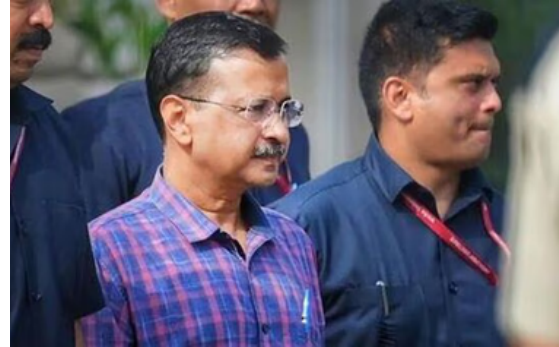
संवाददाता, नई दिल्ली

जमानत के लिए अब सुप्रीम कोर्ट पहुंचे अरविंद केजरीवाल, Delhi High Court से लग चुका है झटका