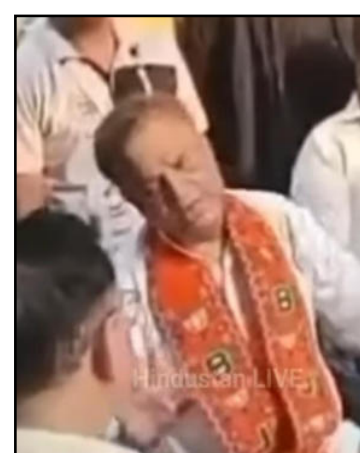
स्पीच के बाद इलाके में संप्रदायिक तनाव