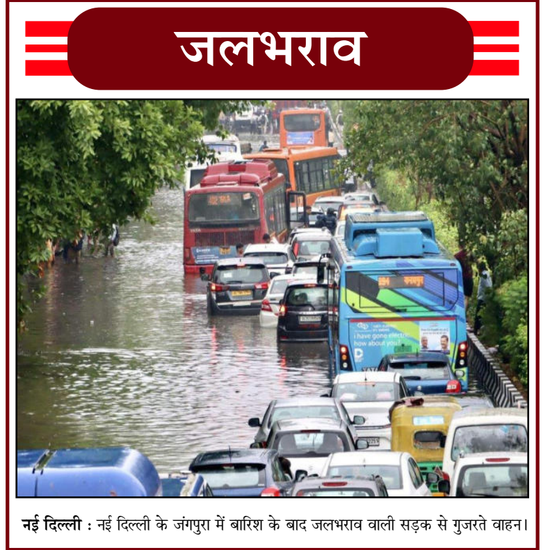
नई दिल्ली : नई दिल्ली के जंगपुरा में बारिश के बाद जलभराव वाली सड़क से गुजरते वाहन।

इस बैठक में कांग्रेस संसदीय दल की अध्यक्ष सोनिया गांधी, कांग्रेस सांसद राहुल गांधी, शरद पवार, रामगोपाल यादव, अखिलेश यादव, तेजस्वी यादव, चंपई सोरेन, अरविंद केजरीवाल, भगवंत मान, डी. राजा, सीताराम येचुरी, कल्पना सोरेन और गठबंधन के कई सहयोगी शामिल रहे।