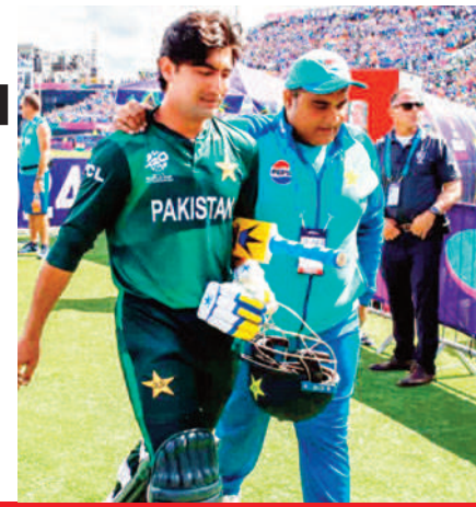
पाकिस्तान वर्ल्ड कप से बाहर

वर्ष : 60, अंक : 163 रांची, रविवार 16 जून 2024 पेज -08, मूल्य : 3 रुपये ज्येष्ठ शुक्ल पक्ष दशमी विक्रम संवत्, 2081