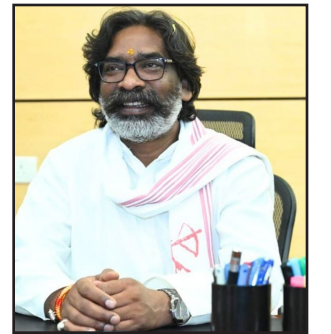
से बढ़ोत्तरी की गयी है। झारखंड के अलग-अलग शहरों को X, Y और Z कैटेगरी में बांटा गया है। सबसे ज्यादा वृद्धि X श्रेणी के शहरों में पदस्थ कर्मचारियों के HRA में होगा, वहीं उसके बाद Y और फिर Z श्रेणी के शहरों के लिए की जायेगी।

रांची: हेमंत कैबिनेट की बैठक में आज कई बड़े फैसलों को मुहर लगी। लेकिन, सबसे खास तोहफा कर्मचारियों को मिला। कैबिनेट ने राज्य कर्मचारियों के एचआरए में बढ़ोत्तरी का फैसला लिया है। वित्त विभाग की तरफ से एचआरए में बढ़ोत्तरी का प्रस्ताव पहले ही तैयार कर लिया गया था, आज कैबिनेट की मंजूरी के बाद इसे राज्यकर्मियों के लिए लागू कर दिया जायेगा। HRA में भी शहरों की कैटेगरी के हिसाब