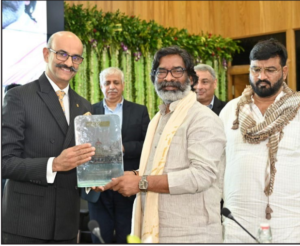
एरिया में स्थित होने की वजह से यह होटल रांची शहर के बीचो-बीच, विधानसभा, सरकारी कार्यालयों और

रांची : झारखंड सरकार और टाटा ग्रुप के बीच एमओयू साइन किया गया। जिसके तहत झारखंड के रांची में तज होटल का निर्माण किया जाएगा। रांची के स्मार्ट सिटी में 6 एकड़ जमीन पर यह होटल चार सालों में बनकर तैयार होगा। 200 करोड़ की लागत से आधुनिक सुविधाओं के साथ बनेगा होटल तज। इस ग्रीनफील्ड प्रोजेक्ट के साथ आईएचसीएल ने रांची में अपना पहला कदम रखा है। राजधानी के कोर कैपिटल