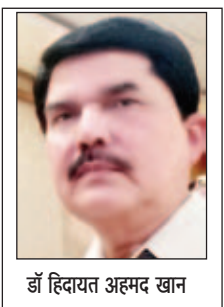
बी जे रेड्डी

अमेरिका के पेंसिल्वेनिया में शनिवार शाम करीब 6:15 बजे पूर्व राष्ट्रपति डोनाल्ड ट्रंप पर उस वक्त जानलेवा हमला हुआ जबकि वो चुनावी रैली को संबोधित कर रहे थे। इस हमले की जितनी भी निंदा की जाए वह कम ही होगी, क्योंकि लोकतंत्र की सबसे बड़ी खूबसूरती यही है कि बिना हिंसा और खून-खराबे के सरकारें बदल जाती हैं। बड़ी से बड़ी समस्या का समाधान बात-चीत से निकाल लिया जाता है। बावजूद इसके लोकतांत्रिक देशों में हिंसा बढ़ रही है, जो वाकई चिंता का विषय है। जहां तक पूर्व राष्ट्रपति ट्रंप पर हुए हमले की बात है तो जब वो चुनावी रैली को संबोधित कर रहे थे तभी फायरिंग हुई और उनके दाहिने कान का ऊपरी हिस्सा जखमी हो गया। अधिक मात्रा में बहते खून को रोकने ट्रंप ने कान में हाथ लगाया और एक सफल नेता