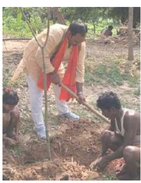
कोलफील्ड मिरर 15 जुलाई