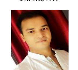
अनंत ज्ञान हजारीबाग (झारखंड) कोलफील्ड मिरर

अभि-अभी कोलकाता के इको पार्क से, लोट रहा हूँ मैं देख कर दुनिया के सभी सात अजूबों की विशाल अद्भूत विलक्षण प्रतिक्रिया, ताज़महल, चीन की दीवार, क्राइस्ट द रिडीमर आदि, सभी की खूबसूरती कैद कर के लोट रहा हूँ मैं केमरे में,