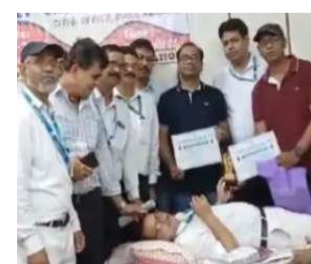
कोलफील्ड मिरर 15 जुलाई (आसनसोल): आसनसोल रेल मंडल के टिकट चेकिंग स्टाफ की तरफ से आसनसोल रेलवे स्टेशन के दो नंबर प्लेटफॉर्म पर मुखा द्वार के समीप रक्तदान शिविर का आयोजन किया गया। शिविर में डीआरएम चेतनादेव सिंह विशेष रूप से उपस्थित थे, उन्होंने रक्तदाताओं को ब्लाड

डोनेशन का सर्टिफिकेट प्रदान किया। मोके पर डीआरएम श्री सिंह ने कहा कि जिस तरह से आसनसोल रेलवे स्टेशन के टिकट चेकिंग स्टाफ द्वारा आज रक्तदान शिविर का आयोजन किया गया है, वह सराहनीय है, उन्होंने कहा कि उन्हें गर्व है अपने कर्मचारियों पर जो इस तरह से अपने दायित्वों का पालन करते हुए