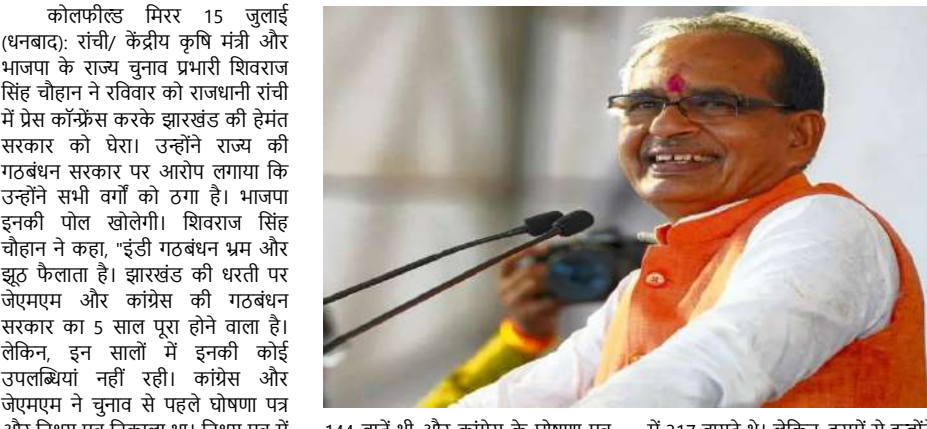
144 बातें थी और कांग्रेस के घोषणा पत्र में 317 वायदे थे। लेकिन, इसमें से इन्होंने

पूरा क्या किया? शिवराज सिंह चौहान ने कहा, "कांग्रेस और जेएमएम झूठ बोलने की मशीनें बन गई हैं, रोज झूठ बोलते हैं कि कम सीट लेकर भी हमने तौर मार लिया। झारखंड में भी ऐसा ही हुआ है। अगर हम लोकसभा के नतीजों को विधानसभा में बदल दें तो हम 81 में से 52 सीटों पर आ गए हैं। झारखंड के विधानसभा चुनाव में सत्ताधारी पार्टी के घोषणा पत्र में किए वायदों पर घेरते हुए शिवराज सिंह चौहान ने कहा कि इन लोगों ने इसमें से पूरा क्या किया? इन्होंने सरकारी नियुक्तियां नहीं की, महिला बैंक की स्थापना करने की बात कही गई थी, वो नहीं हुई। 5,000 और 7,000 रुपए बेरोजगारी भता देने की बात कही गई थी, उसे भी पूरा नहीं किया। उन्होंने आगे कहा कि गठबंधन सरकार के पांच साल पूरे हो रहे हैं, लेकिन उनके वादे पूरे नहीं हो रहे। मैं उनके निश्चय पत्र से ही सवाल पूछ रहा हूँ कि 50,000 का लोन कितनी महिलाओं को मिला? किसानों के लिए बैंक की स्थापना का क्या हुआ? महिलाओं के लिए भाजपा द्वारा लाई गई एक रुपए में रजिस्ट्री की योजना को भी इन्होंने बंद कर दिया। शिवराज सिंह चौहान ने आगे कहा, "तराजू से तोलकर बालू बिक रहा है। खनन नहीं पर्यटन का नारा दिया गया, लेकिन आज सिर्फ खनन हो रहा है। अब भाजपा राज्य की जनता के सामने इनकी पोल खोलेंगी।"