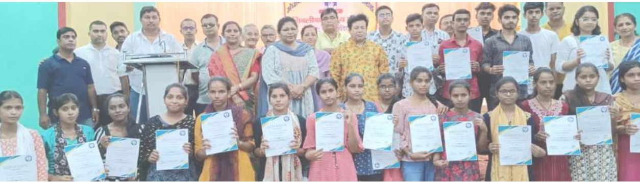
कोलफील्ड मिरर 15 जुलाई (निरसा): वाणी मंदिर क्लब कालीमंडा तथा शिवलीबाड़ी मध्य पंचायत के संजय से मेधावी विद्यार्थी प्रोत्साहन समारोह का