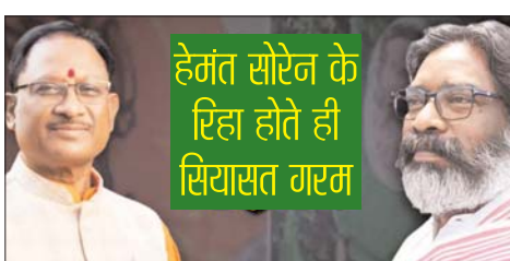
हेमंत सोरेन के रिहा होते ही सिवासत गरम

रांची। छत्तीसगढ़ के मुख्यमंत्री विष्णु देव साय ने झारखंड के पूर्व मुख्यमंत्री हेमंत सोरेन के भाजपा शासित राज्यों के आदिवासी मुख्यमंत्रियों को रबर स्टाम्प बताने वाले बयान पर पलटवार किया। उन्होंने सोरेन परिवार को जनता की गाड़ी कमाई लूटने वाला परिवार कहा। विष्णु देव ने रविवार को सोशल मीडिया एक्स पर कहा कि देशभर में जिस तरह से भाजपा, सक्षम आदिवासी नेतृत्व दे रही है, ऐसा इससे पहले कभी नहीं था। ऐसे में पूर्व मुख्यमंत्री हेमंत सोरेन का आदिवासी