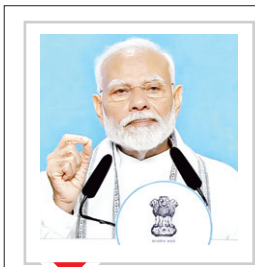
ठाणे से बोरीवली की यात्रा 12 किलोमीटर कम हो जाएगी और यात्रा समय में लगभग एक घंटे की बचत होगी

नई दिल्ली/मुंबई। प्रधानमंत्री नरेन्द्र मोदी ने शनिवार को मुंबई के गोरगांव में आयोजित कार्यक्रम में 29,400 करोड़ रुपये से अधिक की लागत वाली सड़क, रेलवे और बंदरगाह क्षेत्र से जुड़ी कई परियोजनाओं का शुभारंभ किया और आधारशिला रखी। इस अवसर पर प्रधानमंत्री मोदी ने अपने संबोधन में कहा कि छोटे और बड़े निवेशकों ने हमारी सरकार के तीसरे कार्यकाल का उत्साहपूर्वक स्वागत किया है। उन्होंने कहा कि आज मुंबई में शुरू की गई विकास परियोजनाओं से कनेक्टिविटी बढ़ेगी, शहर के बुनियादी ढांचे में उल्लेखनीय सुधार होगा तथा नागरिकों को बहुत लाभ होगा। उन्होंने कहा कि विकसित भारत के निर्माण में महाराष्ट्र की बड़ी भूमिका है।