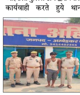
अहिरौली पुलिस टीम द्वारा त्वरित कार्यवाही करते हुये थाना

दैनिक केसरिया हिन्दुस्तान अयोध्या मण्डल ब्यूरो अम्बेडकर नगर। दुष्कर्म के मामले में 12 घण्टे के अन्दर अहिरौली पुलिस ने आरोपी को किया गिरफ्तार जनपद पुलिस द्वारा अपराध व अपराधियों पर प्रभावी अंकुश लगाने हेतु चलाये जा रहे अभियान के क्रम में थाना स्थानीय पर पंजीकृत मु०अ०स० 213/24 धारा 64/115(2)/352/351(2) बी०एन०एस० 2023 व 3(2)बी 3(1)द,घ एस सी/एस्टी एक्ट से सम्बन्धित एक नफर नामजद पुलिस के मुताबिक अभियुक्त को थाना