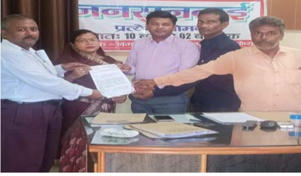
अविलंब उसे चालू कराने की मांग की थी लेकिन आज तक कोई कामयाबी नहीं मिली। गौरतलब हो