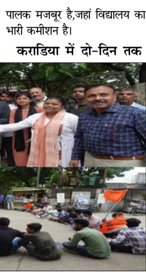
कराडिया में दो-दिन तक चला छात्रों का धरना-2 दिन तक कराडिया में चला धरना एक दिन पूर्व ही समाप्त हुआ है। यहाँ शिक्षकों की कमी को लेकर कांग्रेस नेता व छात्र भूख हड़ताल