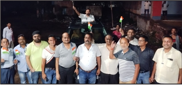
भारत की T20 में वर्ल्ड कप में जीत की खुशी में जश्न मनाते हुए बाजार समिति चेंबर के व्यवसाय गण