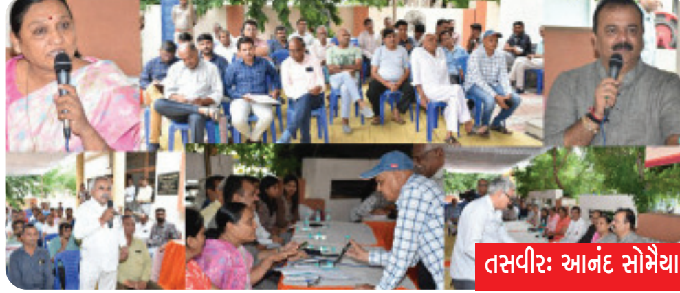
તસવીર: આનંદ સોમૈયા

વોર્ડ નં.પમાં વોર્ડ ઓફિસ, વોર્ડ નં.પ-૬, શ્રી અટલ બિહારી વાજપેયી ઓફિસરિયમ પાછળ, બી-કિવિઝન પોલીસ સ્ટે.ની બાજુમાં યોજાયેલા લોક દરબાર કાર્યક્રમમાં વોર્ડ નં.પના નાગરિકો