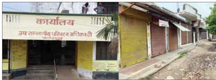
एआरटीओ कार्यालय में पसरे सन्नाटे का दृश्य एवं बंद दुकानें।