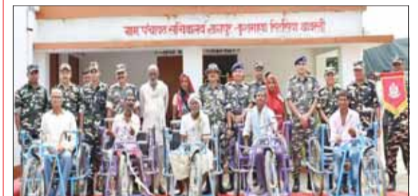
श्रावस्ती। एस.एस.वी. ने सीमावर्ती गांव में विकलांगजनों को बॉटी ट्राई साईकिल