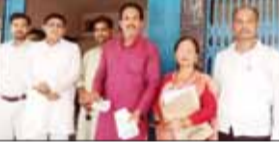
» अभिभावक के आरोपों को बताया निराधार

इसके बावजूद शुल्क नहीं जमा किया। जब बकाया शुल्क अधिक हो गया तो अभिभावक को बुलाकर शुल्क जमा करने की बात कही गई। इस पर