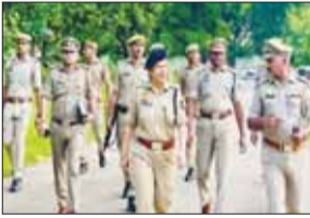
» ड्यूटी के दौरान वर्दी पहनने व जनता से मधुर व्यवहार स्थापित करने के लिए किया निर्देशित