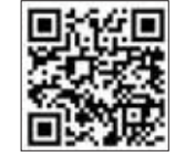
ई-पेपर पढ़ने के लिए स्कैन करें हमारा क्यू आर कोड