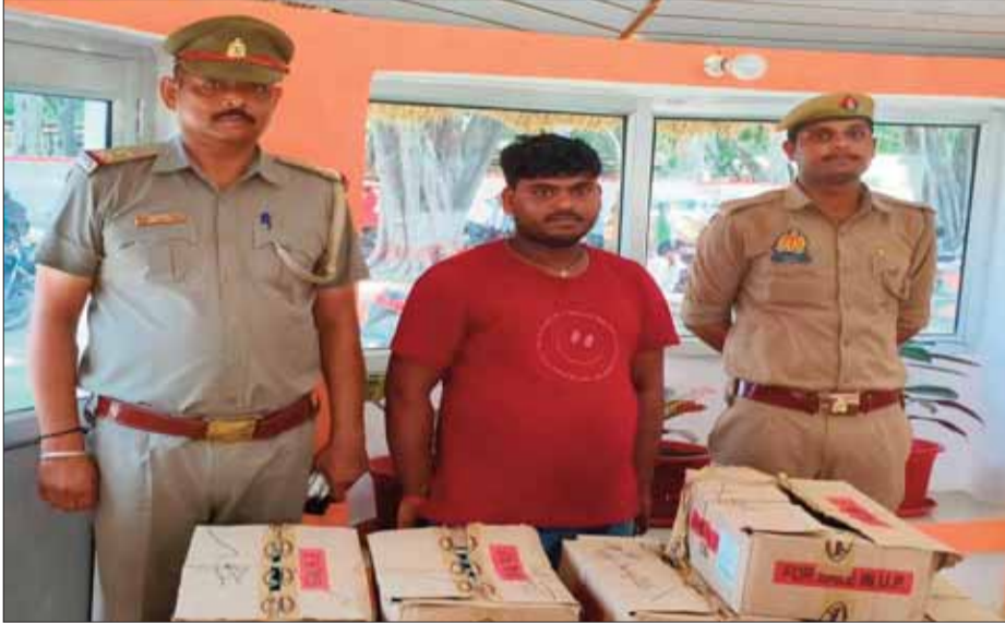
अवैध शराब के साथ पकड़ा गया सेल्समैन

भारी मात्रा में देशी शराब के पौवा व नकली क्यूआर कोड बरामद