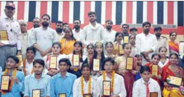
कार्यक्रम में प्रतिभाग करने वाले छात्रों को सम्मानित करती पूर्व केंद्रीय राज्यमंत्री साध्वी निरंजन ज्योति।

फतेहपुर। कारगिल विजय दिवस पर भारतीय जनता युवा मोर्चा की ओर से दो दिवसीय कार्यक्रम के तहत शुक्रवार को प्रेक्षागृह परिसर में विभिन्न सांस्कृतिक कार्यक्रमों के साथ-साथ सभा का आयोजन कर वीर सैनिकों को श्रद्धांजलि अर्पित की। सभा में मुख्य अतिथि के रूप में पूर्व केंद्रीय राज्यमंत्री साध्वी निरंजन ज्योति रहीं।