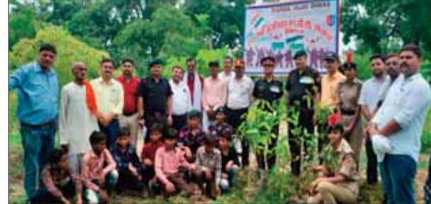
कारगिल दिवस के मौके पर पीथापोषण करते एनसीसी कैडेट्स व अन्य