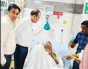
» 24 को आगरा एक्सप्रेस वे पर टुक ने बस को मारी थी टोकर