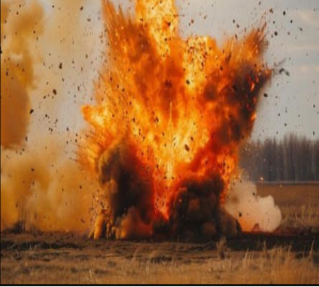
टीएनटी समतुल्य यानी टीएनटी के बराबर माना विस्फोटक माना जा रहा है।

स्क्रीम के तहत टेस्टिंग की गई है। इस विस्फोटक के इस्तेमाल से वर्तमान हथियारों की क्षमता में कई गुना की बढ़ोतरी होगी। यही नहीं भारत द्वारा विकसित किए गए इस विस्फोटक को दुनियाभर की सेनाएं इस्तेमाल करने के लिए आगे आएंगीं। बता दें कि इस नए विस्फोटक को मेक इन इंडिया के तहत, इकोनॉमिक एक्सप्लोसिव लिमिटेड ने विकसित किया है। बता दें कि किसी विस्फोटक की क्षमता या उसकी ताकत को टीएनटी से तुलना कर अंकी जाती है। टीएनटी का मतलब टूटनाइट्रोटाइलिन है जो दुनिया का सबसे लोकप्रिय और ताकतवर विस्फोटक है। एक ग्राम टीएनटी के विस्फोट में निकलने वाली ऊर्जा लगभग 4000 जूल के बराबर होती है। एक मॉट्रिक टन यानी एक हजार किलोग्राम टीएनटी के धमाके से जितनी ऊर्जा निकलती है उसे