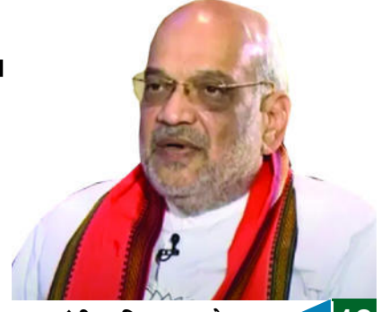
गृह मंत्री अमित शाह ने...