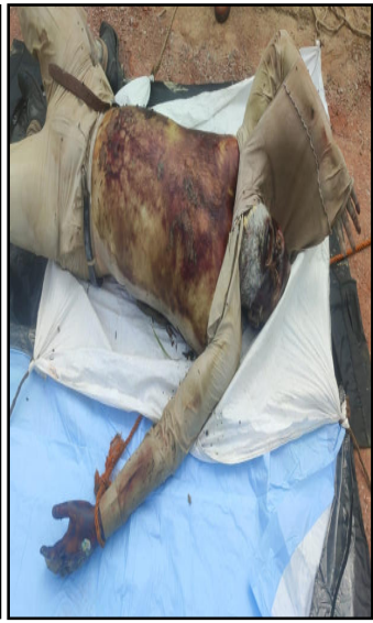
व नहर से बरामद जज का शव