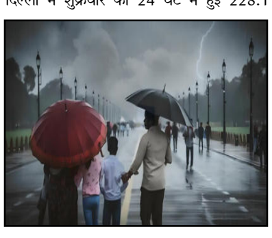
दिल्ली में शुक्रवार को 24 घंटे में हुई 228.1 मिलीमीटर बारिश ने 88 सालों का रिकॉर्ड तोड़ दिया था। बारिश 27 जून को सुबह 8:30 बजे से 28 जून सुबह 8:30 बजे के बीच दर्ज की गई थी। इस दौरान सबसे अधिक बारिश सुबह 5:30 बजे से 8:30 बजे हुई थी। इससे पहले 1936 में 28 जून को 235.5 मिलीमीटर बारिश हुई थी।

नई दिल्ली (आरएनएस)। दिल्ली में बारिश का क्रम शुरू हो गया है। यहां अलग-अलग इलाकों में अगले 7 दिन तक लगातार रुक-रुककर बारिश की संभावना जताई गई है। इस बीच भारतीय मौसम विभाग (आईएमडी) ने दिल्ली में 2-3 जून को भारी बारिश की संभावना को देखते हुए ऑरेंज अलर्ट जारी किया है। इससे पहले रविवार को दिल्ली में 9 मिलीमीटर बारिश दर्ज की गई थी। बारिश के बाद से राष्ट्रीय राजधानी के तापमान में 4 से 5 डिग्री की गिरावट आई है।