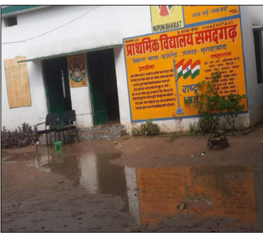
स्कूल में पानी भर जाता है सभी 6 कमरों में पानी भरने के कारण पढ़ाई पर प्रतिकूल असर पड़ रहा है अब तक अनेक