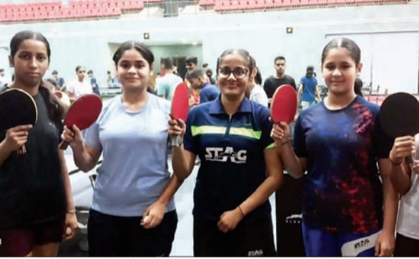
14 से 16 अक्टूबर तक 'द स्पोर्ट्स हब' में होगा टूर्नामेंट का आयोजन