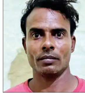
जन एक्सप्रेस | कन्नौज