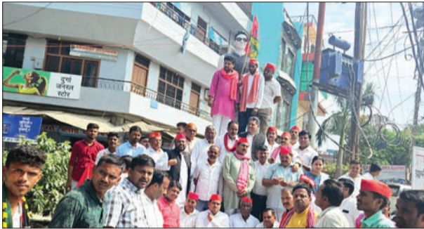
जन एक्सप्रेस | कन्नौज