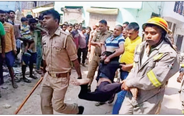
जन एक्सप्रेस | कानपुर नगर

ग्वालदोली इलाके में शनिवार सुबह करीब सात बजे मकान खाली कराने को लेकर मकान मालिक के बेटे और किराएदारों के बीच विवाद हो गया। मकान मालिक के बेटे ने किराएदारों को घर से बाहर निकालकर भीतर से कुंडी बंद कर ली और उनके कमरों में घुसकर तोड़फोड़ की। किरायेदारों ने घर के बाहर से विरोध किया तो मकान मालिक के बेटे ने चौथी मंजिल से ही ईट-पत्थर चला दिए। सूचना पर पहुंची पुलिस ने युवक को पकड़ने की कोशिश की तो उसने आत्महत्या की धमकी दे दी। यही नहीं, पुलिस पर भी पथराव किया जिसमें एक दरोगा व सिपाही समेत छह लोग घायल हो गए। चार घंटे तक चले बवाल के बाद