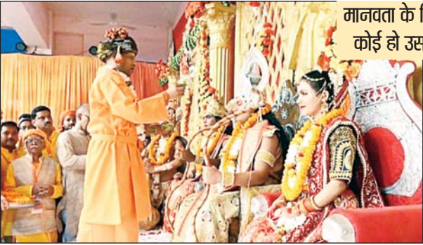
मानवता के खिलाफ काम करने वाला, चाहे वह कोई हो उसका रावण की भांति जलेगा पुतला

मुख्यमंत्री एवं गोरक्षपीठाधीश्वर योगी आदित्यनाथ ने कहा कि जब हम संगठित रहेंगे तो सुरक्षित रहेंगे। छुआछूत, अशुभप्रथा को दूर कर एकजुट रहेंगे खुद की और राष्ट्र की भी सुरक्षा कर सकेंगे। हमें उन पाखंडों से दूरी बनाकर रहना है जिससे चलते गुलामी का दंश झेलना पड़ा और आक्रांताओं को हमारे धर्म स्थलों को खंडित करने तथा सामाजिक ताने बाने को छिन्न भिन्न करने का मौका मिला। सीएम योगी विजयादशमी की शाम मानसरोवर रामलीला मैदान में श्री श्री रामलीला समिति, आर्यनगर की तरफ से आयोजित प्रभु श्रीराम के राजतिलक समारोह को संबोधित कर रहे थे। उन्होंने सभी लोगों को विजयादशमी की बधाई और शुभकामनाएं देते हुए कहा कि संगठित न रहने के कारण ही गुलामी के अलग अलग कालखंड में कभी काशी में विश्वनाथ मंदिर, अयोध्या में राम मंदिर और मथुरा