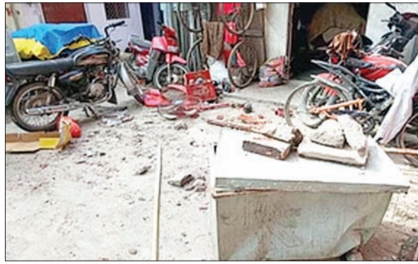
जन एक्सप्रेस | कानपुर नगर

पथराव की सूचना पर पहुंचे मीडिया कर्मियों को कई पुलिसकर्मियों ने घटनास्थल पर समाचार संकलित करने मना करते हुए धमकी दी। इसके बाद घायल दरोगा व सिपाही को पुलिसकर्मी उर्सला लेकर गए, तो वहां भी मीडिया कर्मियों से पुलिस वालों ने बदसलूकी की और उनके कैमरे पकड़ते हुए कुछ भी बताने से मना कर दिया।