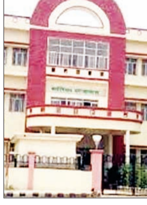
जन एक्सप्रेस | कन्नौज

राजकीय मेडिकल कॉलेज में एक बच्ची का इलाज कराने पहुंचे पिता के साथ डॉक्टर और स्वास्थ्य कर्मियों