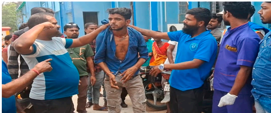
तीन युवक पहुंचे थे बाइक चोरी करने

धनबाद: जिले के सबसे बड़े सरकारी अस्पताल एसएनएमएमसीएच में बाइक चोरी की कोशिश करने के आरोप में लोगों ने एक युवक को पकड़ कर जमकर धुनाई कर दी. लोगों के मुताबिक अस्पताल परिसर में खड़ी बाइक को युवक अपनी चाबी से खोलने की कोशिश कर रहा था. इस दौरान लोगों की नजर उस पर पड़ गई. इसके बाद मामले की सूचना पुलिस को दी गई. जानकारी मिलने के बाद सरायढेला थाना की पुलिस मौके पर पहुंची और आरोपी युवक को हिरासत में लेकर थाना ले गई है.