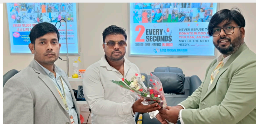
जायजा लिया उन्होंने बताया कि यह ब्लड पूरे जिले में सबसे आधुनिक, आकर्षक एवं भव्य हैं उनके मरीजों के लिए लाभदायक साबित होगी यहा ब्लड के साथ