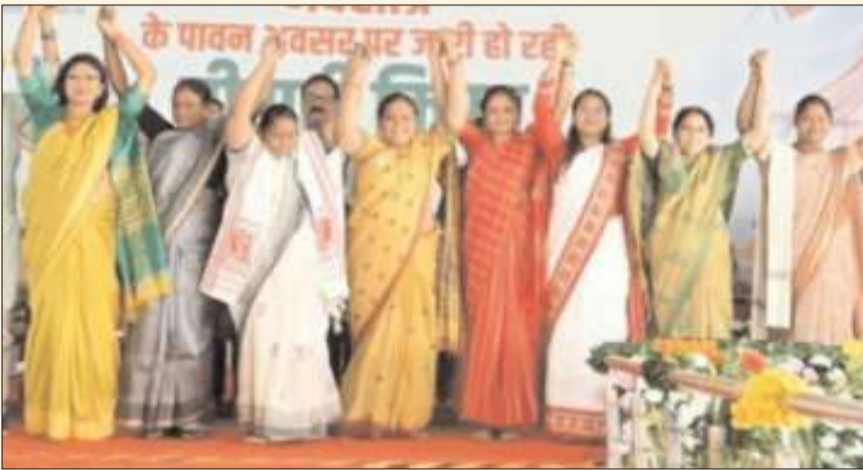
योजना को भी अनुमति देनी चाहिए। क्या है जेएमएम की योजना? : दरअसल, हेमंत सोरेन की जेएमएम सरकार झामुमो सम्मान योजना लागू करने की कोशिश में है। इसके लिए पार्टी ने चुनाव आयोग को ज्ञापन भी सौंपा है। हेमंत सरकार ने इस योजना के तहत महिलाओं को प्रति माह 2500 रुपये यानी सालाना 30

रांची। झारखंड की हेमंत सोरेन सरकार राज्य की महिलाओं को सालाना 30 हजार रुपये देने की योजना बना रही है। राज्य में सत्ताधारी दल झारखंड मुक्ति मोर्चा ने बुधवार को चुनाव आयोग को ज्ञापन सौंपा है और राज्य में 'झामुमो सम्मान योजना' लागू करने की अनुमति देने का अनुरोध किया है। झारखंड मुक्ति मोर्चा ने कहा है कि भाजपा ने झारखंड में 'गो गो दीदी योजना' लाने का प्रस्ताव रखा है जिसके तहत महिलाओं को सालाना 25 हजार रुपये देने की बात कही गई है। जेएमएम ने कहा है कि अगर आयोग को पता चलता है कि भाजपा की ओर से प्रस्तावित की गई योजना अवैध नहीं है, तो उसे हमारी इस