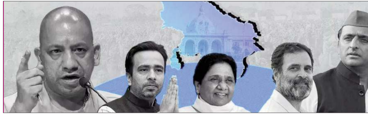
लोक तंत्र की आवाज

रत्ना लखनऊ। उत्तर प्रदेश की 10 विधानसभा सीटों पर होने वाले उपचुनाव की तारीखों का एलान आज चुनाव आयोग ने कर दिया है। यूपी की नौ विधानसभा सीटों पर 13 नवंबर को मतदान होगा। जबकि 23 नवंबर को मतगणना की जाएगी। बता दें यह उपचुनाव 2027 विधानसभा चुनाव का सेमीफाइनल भी माना जा रहा है। जानिए क्यों खाली हुई थी ये 10 सीटें? प्रदेश की जिन 10 सीटों पर उपचुनाव होगा, उसमें कानपुर की सीसामऊ, प्रयागराज की फूलपुर, मैनुपुरी की करहल, मिर्जापुर की मझवा, अयोध्या की मिल्कीपुर, अंबेडकरनगर की कटेहरी, गाजियाबाद सदर, अलीगढ़ की खैर, मुरादाबाद की कुंदरकी और मुजफ्फरनगर की मीरापुर सीट शामिल है।