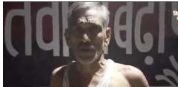
लोकतंत्र की आवाज