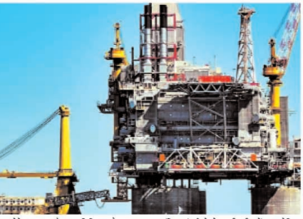
अमेरिका गैर-ओपेक लाभ के 2.1 मिलियन बैरल प्रतिदिन के लिए रिजर्वेट है, जबकि अर्जेंटीना, ब्राजील, कनाडा और गुयाना प्रति दिन 2.7 मिलियन बैरल का योगदान देते हैं।

इसके चलते 2020 में कोविड-19 लोकडाउन के चरम के अन्ताल पहले कमी नहीं देखी गई अतिरिक्त शमता का स्तर होगा। ऐसे स्तर पर अतिरिक्त शमता का तेल बाजारों के लिए महत्वपूर्ण परिणाम हो सकता है - जिन्में OPEC और उससे आगे की उम्मीदें अर्थव्यवस्थाएं, साथ ही साथ यूएस शेरत उद्योग भी शामिल हैं। जैसे-जैसे महामारी की वापसी धीमी होती जा रही है, जेलोन एनर्जी ट्रांज़िशन आगे बढ़ रहा है और चीन की अर्थव्यवस्था की संरचना बदल रही है, वैश्विक तेल मांग में वृद्धि धीमी हो रही है और 2030 तक अपने चरम पर वृद्धि वाली है। यह उम्मीद की जा रही है कि इस साल डिमांड प्रिदिन लगभग 1 मिलियन बैरल बढ़ेगा। नेटेटेस्ट ऑकड़ों के आधार पर अक्टूबर रिपोर्ट के अनुसार इस दशक में एक प्रमुख आउटपुट अतिरिक्त को दर्शाते हैं, जो यह दर्शाते हैं कि तेल कर्षणों यह सुनिश्चित करना चाहती हैं कि उनको व्यापारिक रणनीतियों और योजनाएं होने वाले परिवर्तनों के लिए तैयार हों।