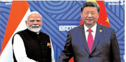
शासनमन्थकों के मध्य यह वार्ता ग्लोबल युद्धों के लम्बे अंतराल के दृष्टि जिससे लगा कि अब भारत और चीन के मध्य जमी बर्फ अंध पिघल रही है। दोनों शासनमन्थकों की भेंट के बाद यह समाचार भी आ गया है कि भारत और चीन के मध्य ह्यु समझौते के अनुसर पूर्ण लड़ाय संपेट

ब्रिक्स शिखर सम्मेलन में पूरे विश्व को दुष्ट भारत के प्रधानमंत्री मोदी व चीन के राष्ट्रपति शी जिनपिंग के मध्य होने वाली द्विपक्षीय वार्ता पर धी वयोकि ब्रिक्स सम्मेलन के पूर्व ही भारत और चीन के मध्य सीमा विवाद को हल करने के लिए समझौता बन गई। प्रधानमंत्री नरेंद्र मोदी अपने तीसरे कार्यकाल में वैश्विक स्तर को गम्भीर समस्याओं के समाधान के लिए सक्रिय हैं। प्रत्येक वैश्विक मंच पर प्रधानमंत्री नरेंद्र मोदी व विदेश मंत्री एस जयशंकर अपनी उपस्थिति दर्ज कर रहे हैं। युद्ध व आतंकवाद के कारण आंतरिक विषय को प्रष्टि अथवा वैश्विक शांति की स्थापना के लिए भारत की धृष्टि है और प्रधानमंत्री नरेंद्र मोदी इसके लिए संकल्पवन्त हैं। प्रधानमंत्री मोदी रूस - यूक्रेन युद्ध से लेकर हज़ारों-अरब के बीच चल रहे तनाव