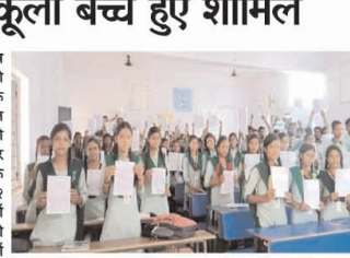
राज्य में इस तरह के अभियान विधानसभा निर्वाचन के दौरान मतदाताओं को जागरूक करने एवं मतदान के लिए प्रेरित करने के लिए लगातार चलाये जायेंगे. उन्होंने इस अभियान से जुड़े सभी छात्र-छात्राओं की हार्दिक-अभिनवां की.