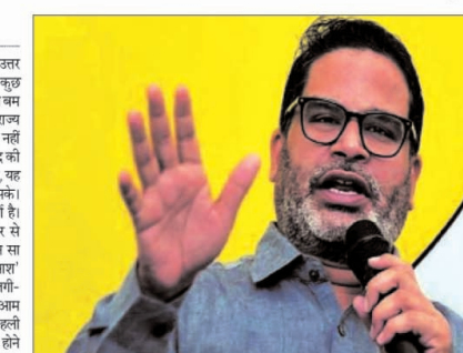
वयोकि आप लाख विकास करें, एक मोंडरोसा आता है जहां आपको कुछ निगम लेने होंगे हैं, जिसके लिए आपको पास एक वैचारिक आधार होना चाहिए। मसलन, आश्रय हो या पुंजी का विश्व, आप किशर जायें, कैसे जायें, आप लैपट है, घाट है, सैटर है, सैटर ट टूट है या सैटर ट लैपट है, तो, आपको यह साफ करना होगा, सौन ठोकर कर मोलना होगा कि हम ये हैं। एग्रेस-इस सी है, और विधावक बनाने हैं। चुनाव विधावका हमें आता है। लोकतंत्र के लिए कोई जगह नहीं होती। कुछ दिन, कुछ सप्ताह यह प्रोग्रेस हो भी जाए, तो लंबी रस के पोल के बिस्मका हो ही चाहिए। स्वयं प्रशांत किशोर में प्रोग्रेस बहुत अधिक है, ऐसा मैंने कई बार महसूस किया है। संचय है कि मेरी समझ या फोइलवग मतलब है लेकिन एक आम

जानि का जाल-बिहार या कमोबेश उरर भारत की राजनीति में जानि का जलवा कुछ उसी तरह का है कि आभी रेंटी खायो, परत बन जानो। मतलब, जानि के लिए विकास (राज्य या खुद का) को लगाने में शर्त सैकंड भी नहीं लगती। इस स्थिति में प्रशांत किशोर को खुली जानि एक बहुत बड़ी चुनौती होगी। हालांकि, यह एसी चुनौती भी नहीं है, जिसे तोड़ न जा सके। लेकिन, ये इसे कैसे तोड़ेगे, यह महत्वपूर्ण है। सिर्फ विकास-विकास की रट लगाने भर से कम नहीं चलने वाला, वयोकि ऐसा कभी सा नेता है जो कहता है कि हम बिहार का 'बिनाश' करना चाहते हैं। आभी आबादी की नाराजगी-शावबंदी को लेकर प्रशांत किशोर ने खुलेआम कह दिया है कि उनको सरकार बनी तो पहले बैटम में शरवबंदी हटाएंगे और उससे होने वाली कमाई से शिक्षा पर खर्च करेंगे। सुझाव बहुत अच्छा है। नीयत भी अच्छी लगती है। लेकिन, राजनीतिक रूप से नीतिय कुमार ने इस मुद्दे को बिहार की आभी आबादी के सेंट्रीमेंट से जोड़ दिया है और बहुत गहराई से जोड़ दिया है। बिस्मका फरफुदा यह-हर कर उन्हें खाना में मिलता भी है। वैचारिक अस्पष्टता-गहना बहुत बड़ी स्ट्रिपटाइप लगता है लेकिन यह बहुत महत्वपूर्ण और दीर्घकालिक अस्तर वाला भी,