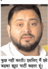
कुछ नहीं करती। इसलिए मैं इसे बड़का झूठा पार्टी कहता हूँ।