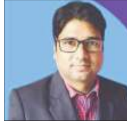
लोक तंत्र की आवाज