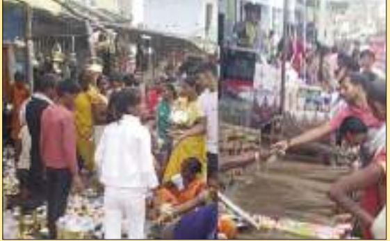
प्रदीप प्रसाद संवाददाता सिरदला

सिरदला प्रखंड में आज धनतेरस के अवसर पर बाजारों में सुबह से ही लोग खरीददारी करते नजर आए। आभूषणों, बर्तनों, मिठाईयों, झाड़ू, गोरी गणेश की मूर्ति की दुकानों पर लोगों की भीड़ लगी रही। इस पर्व को लेकर लोगों की मान्यता है कि आज के दिन बर्तन आभूषण खरीदना शुभ होता है। इसलिए हर साल इस दिन खरीदारी करना परंपरा बन चुका है। बर्तन विक्रेताओं ने बताया कि सुबह से ही ग्राहक धनतेरस पर बर्तनों की खरीदारी के लिए पहुंचने लगे थे। वह यहीं बતાते हैं की महंगी आभूषण नही खरीदने वाले लोग धातु की बर्तन जकर खरीदारी करते हैं। धनतेरस पर धातु की परंपरा खरीदना विशेष रूप से शुभ माना जाता है। इस बीच धनतेरस पर बाजारों में भीड़ के कारण जाम की समस्या बनी रही।