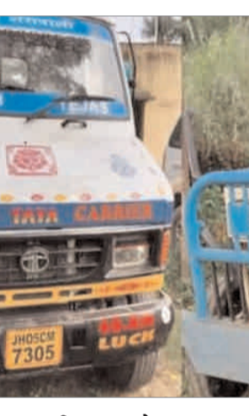
रोका गया। इसके पूर्व ही गाड़ी चालक पुलिस को देखते ही भागने लगे, जिसमें एक चालक को दबोच लिया गया है और दूसरा भागने में सफल रहा।

फ्रीडम फाइटर संवाददाता जमशेदपुर : आदित्यपुर पुलिस ने सोमवार की रात अवैध बालू खनन के खिलाफ अभियान चलाकर दो वाहनों को जब्त किया है। यह कार्रवाई खनन विभाग और एसपी के निर्देश पर हुई है।