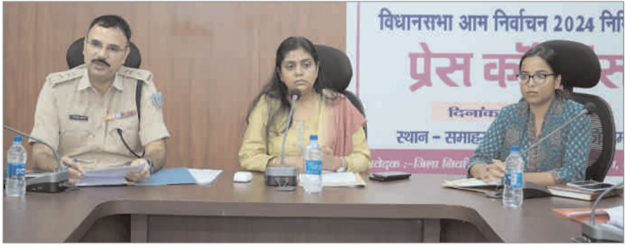
कुल 04 लाख 05 हजार 190 मतदाता जिला निर्वाचन पदाधिकारी सह उपायुक्त ने बताया कि 19 कोडरमा विधानसभा क्षेत्र में 429 मतदान

अक्टूबर 2024 को होगी। नामांकन वापस लेने के लिए अभ्यर्थी के पास 30 अक्टूबर 2024 तक का समय रहेगा। मतदान 13 नवंबर 2024 होगा। मतगणना 23 नवंबर 2024 को होगा। जिला निर्वाचन पदाधिकारी ने बताया कि आदर्श आचार संहिता के पालन के लिए पूरी तैयारी की गई है।