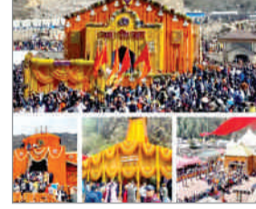
■ अब तक 40 लाख से अधिक तीर्थयात्री पहुंचे चारधाम

देहरादून : हरी-भरी वादियां, ऊंचे-ऊंचे पहाड़, सिद्धीनुमा-चुमावदार सड़कें, हिमालय व हिल स्टेशन समेत देवभूमि का प्राकृतिक सौंदर्य इन दिनों पर्यटकों को खूब लुभा रहा है। मई से शुरू हुई राज्य की चारधाम यात्रा इस वर्ष अब तक तीर्थयात्रियों का आंकड़ा 40 लाख पार कर चुका है। राज्य में अब तक चार लाख 80 हजार 788 वाहन भी चारधाम पहुंच चुके हैं। अभी भी बड़ी संख्या में तीर्थयात्री चारधाम यात्रा पर देवभूमि पहुंच रहे हैं। दरअसल, इस वर्ष की चारधाम यात्रा अब अंतिम चरण में है। आने वाले दिनों में सभी धाम छह माह के लिए बंद हो जाएंगे। ऐसे में हरिद्वार से लेकर उच्च हिमालय तक आस्था पथ