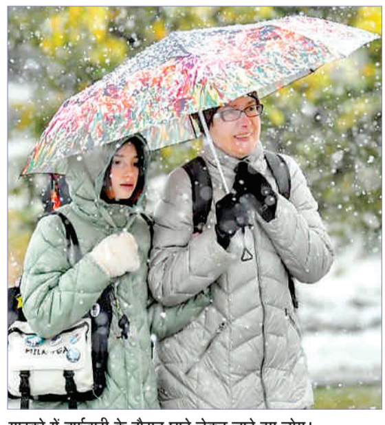
मास्को में बर्फबारी के दौरान छाते लेकर जाते हुए लोग।

नयी दिल्ली : क्वाड देशों के बीच विशाखापट्टनम तट पर चल रहे बहुराष्ट्रीय समुद्री अभ्यास मालाबार का बंदरगाह समाप्त हो गया है। इस दौरान ऑस्ट्रेलिया, भारत, जापान और अमेरिका की नौसेनाओं ने महत्वपूर्ण समुद्री जुड़ाव के रूप में हिस्सा लिया। अब मंगलवार से बंगाल की खाड़ी में समुद्री चरण शुरू हुआ है, जिसमें चारों नौसेनाओं के युद्धपोत, हेलीकॉप्टर और लंबी दूरी के समुद्री तहजीब विमान एक साथ अभ्यास करके उच्च स्तर के सहयोग और परिचालन तालमेल का प्रदर्शन कर रहे हैं। बहुराष्ट्रीय समुद्री अभ्यास मालाबार के दूसरे और अंतिम समुद्री चरण में हिस्सा लेने के लिए ऑस्ट्रेलिया, भारत, जापान और अमेरिका की नौसेनाएं बंगाल की खाड़ी में पहुंच गई हैं।