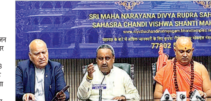
■ सबसे बड़ा श्री महानारायण दिव्य रुद्र सहित शत सहस्र चंडी विश्व शांति महायज्ञ