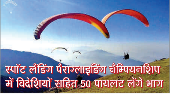
स्पोर्ट लैंडिंग पैराग्लाइडिंग चैम्पियनशिप में विदेशियों सहित 50 पायलट लेंगे भाग