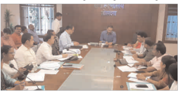
सुनिश्चित करने का निर्देश दिया गया। प्रशिक्षण कोषांग को जुटिहरित और प्रत्येक बिंदु का प्रशिक्षण सुनिश्चित करने का निर्देश दिया गया ताकि मतदान के दौरान किसी प्रकार की समस्या नहीं उत्पन्न हो।