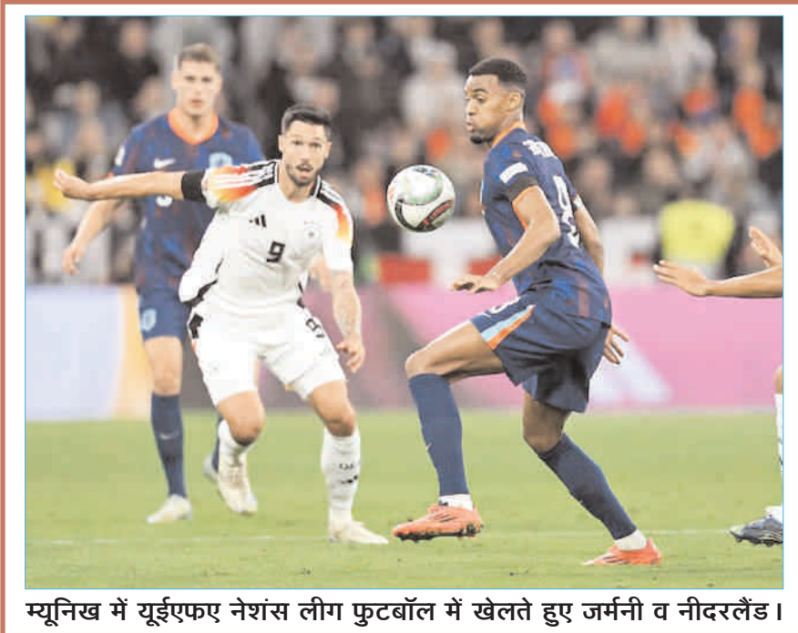
म्यूनख में यूईएफए नेशंस लीग फुटबॉल में खेलते हुए जर्मनी व नीदरलैंड।

दीपि शर्मा और रेणुका ठाकुर शीर्ष रैंकिंग के करीब भारतीय टीम के स्टार खिलाड़ी दीपि शर्मा और रेणुका ठाकुर महिला टी20 गेंदबाजों की रैंकिंग में संयुक्त तीसरे स्थान पर पहुंच गई हैं। दीपि एक स्थान ऊपर और रेणुका ठाकुर दो स्थान ऊपर उठकर संयुक्त रूप से तीसरे स्थान पर पहुंची हैं। इंग्लैंड की बाएं हाथ की स्पिनर सोफी एक्लेस्टोन गेंदबाजी की रैंकिंग में शीर्ष स्थान पर हैं। ऑस्ट्रेलिया की तेज गेंदबाज मेगन स्कट और दक्षिण अफ्रीका की स्पिनर नॉनकुलुलेको म्लाबा ने भी उल्लेखनीय प्रगति की है। मेगन स्कट चार स्थान ऊपर उठकर छठे स्थान पर, नॉनकुलुलेको छह पायदान ऊपर सातवें स्थान पर पहुंची हैं।