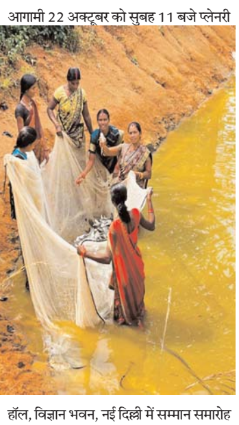
आगामी 22 अक्टूबर को सुबह 11 बजे प्लेनरी हॉल, विज्ञान भवन, नई दिल्ली में सम्मान समारोह