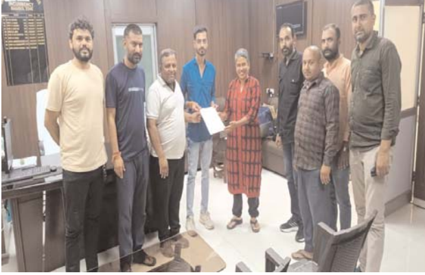
आईजी को युवा कांग्रेस ने सौंपा ज्ञापन

दस्त ही बताते हैं, प्रत्यक्षदर्शी विरोध करते हैं की मारपीट और हत्या का मामला है, बूढ़ार पुलिस मर्ग कायम करती है, जहां चड़ाई पुलिस के हवाले की जाती है चड़ाई पुलिस कहती है पीएम रिपोर्ट के आधार पर कार्यवाही