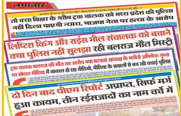
पुलिस अधीक्षक से करुंगा बात- जिलाध्यक्ष कांग्रेस