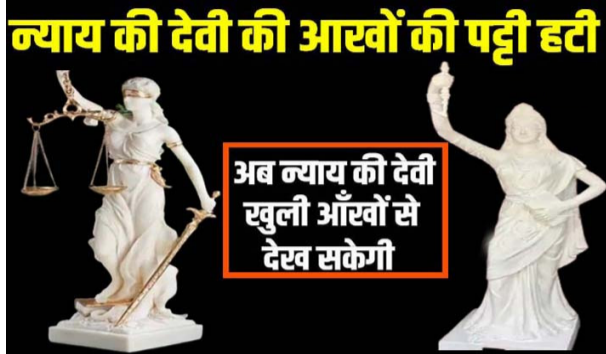
न्याय की देवी की आँखों की पट्टी हटी अब न्याय की देवी खुली आँखों से देख सकेगी

नई दिल्ली । भारतीय न्यायपालिका ने ब्रिटिश एरा को पीछे छोड़ते हुए नया रंग-रूप अपनाया शुरू कर दिया है। सुप्रीम कोर्ट का ना केवल प्रतीक बदला है बल्कि