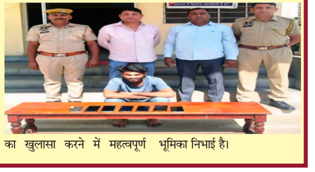
का खुलासा करने में महत्वपूर्ण भूमिका निभाई है।