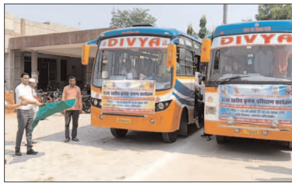
उत्पादन की तकनीकी जानकारी प्राप्त करने के साथ ही पशुपालन एवं दुग्ध