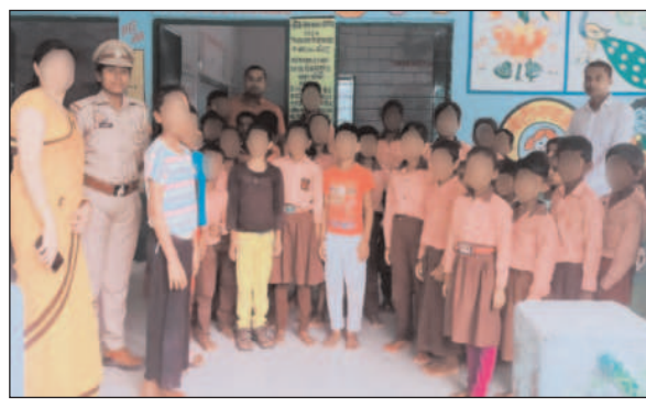
महिलाओं/बालिकाओं/छात्र-छात्राओं को स्वयं की सुरक्षा हेतु विभिन्न पैतरो के साथ-साथ 3090 सरकार द्वारा जारी किये गये हेलपलाइन नम्बरो 1090-1098-चाइल्ड लाइ?, 102-

सबसे तेज प्रयागराज फतेहपुर। पुलिस अधीक्षक, फतेहपुर के कुशल निर्देशन में तथा अपर पुलिस अधीक्षक, फतेहपुर के निकट पर्यवेक्षण में आयोजित हैमिशन शक्तिह्र पंचम चरण व ऑपरेशन जागृति के तहत नारी सशक्तिकरण की कार्यवाही के अन्तर्गत समाज में नारी सुरक्षा व सम्मान एवं नारी स्वावलम्बन हेतु जनपद के समस्त थानों द्वारा अपने-अपने थाना क्षेत्रों में महिला पुलिसकर्मी (शक्ति दीदी) व पुरुष पुलिसकर्मियों द्वारा शरीर एवं ग्रामीण अंचलों में जाकर भीड़-भाड़ वाले इलाकों, कस्बों, गांवों चौपाल लगाकर