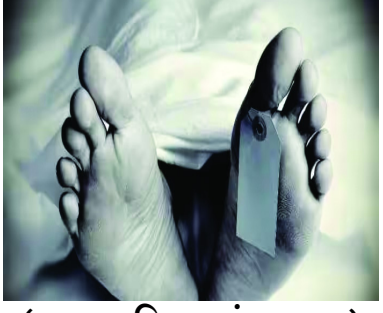
(સામના મિરર, સંવાદદાતા)

રાજકોટ. તા.૮ રાજકોટ-જામનગર રોડ પર આવેલ ગ્રીન લિક્વિડ વોટરપાર્કમાં કૃણ ઘટના ઘટી હતી. વોટરપાર્કમાં આવેલ લોખંડના શેડ પર ત્રીજા માળે વેલ્ડિંગ કામ કરતી વેળાએ એકાએક નીચે પટકાતા શ્રમિક ચુપકનું ઘટનાસ્થળે જ કૃણ મોત નીપજ્યું હતું. બનાવની જાણ થતા પોલીસ સ્ટાફ ઘટનાસ્થળે દોડી ગયો હતો.