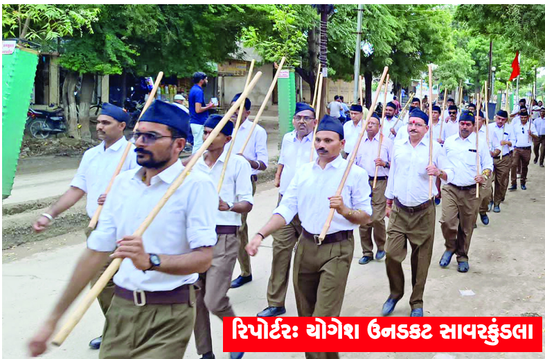
રિપોર્ટર: યોગેશ ઉનડકટ સાવરકુંડલા

બાળકોથી લઈને વૃદ્ધો સુધીના સંઘ કાર્યકર્તાઓએ પરમ પૂજ્ય ભગવા ધવજ અને ગણપેશમાં સજ્જ થઈને શહેરના માર્ગો પર શોભા વધારી હતી. નગરવાસીઓએ પણ ઉત્સાહપૂર્વક આ કાર્યક્રમમાં જોડાઈને ભગવા ધવજ પૂજન તેમજ પુષ્પવર્ષા કરીને સ્વાગત કર્યું હતું. તેમજ સ્વયંસેવકો દ્વારા આર એસ એસ ની સ્થાપના શતાબ્દી વર્ષ નિમિત્તે પંચ પરિવર્તન વ્યવહારમાં લેવા