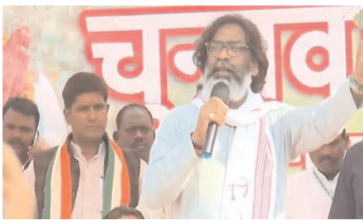
शामुगो की सरकार बनी तो घर बैठे और आय प्रमाण पत्र मिलेगा. इसके लिए प्रबंध, अंचल या डीसी ऑफिस का चक्र नहीं लगाना पड़ेगा.

रांची (एजेंसी): एक तरफ प्रधानमंत्री नरेंद्र मोदी ने जेएएम, सरकार पर निशाना साधा तो दूसरी तरफ सीएम हेमंत सोरेन ने भी भाजपा पर जमकर हमला बोला. सीएम ने कहा कि विपक्ष ने एक साजिश के तहत हमारी सरकार का कार्यकाल पूरा नहीं करने दिया. चुनाव समय से एक महीने पहले करवाया जा रहा है. भाजपा को लगने लगा कि ये सरकार लंबे समय तक रह गई तो भाजपा को झंडा डोने वाला भी नहीं मिलेगा. सीएम सोमवार को डालटगंज में चुनावी जनसभा को संबोधित कर रहे थे. उन्होंने कहा कि भाजपा ने हमारी सरकार के लोगों को बहकाने का भी काम किया. सरकार मित्रों की साजिश थी.