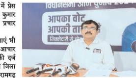
मतदान के लिए सवैतनिक अवकाश सुनिश्चित करने पर है. उन्होंने कहा कि अगर रांची में किसी संस्थान में कोई कार्यरत है और वह पाकुड़ में मतदान करने जाना चाहता है, तो उसे भी समय से अवकाश देना नियोजकों के लिए अनिवार्य है. वहीं उन्होंने हर छोटे-बड़े संस्थानों को अपने कर्मियों के साथ जय लोगो को भी मतदान के लिए प्रेरित करने के लिए अपने संस्थान में गठित बोट अवेरनेस फोरम के जरिये सपरिवार मतदान के लिए विभिन्न तरह के मतदाता जागरूकता कार्यक्रम चलाए की अपील की. उन्होंने बताया कि राज्य में आदर्श आचार संहिता लागू होने के बाद दूसरी ओर उन्होंने कहा कि निर्वाचन आयोग का अधिकार हर तरह के संस्थानों में कार्यरत लोगों को