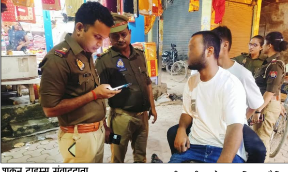
शकुन टाइम्स संवाददाता

चंदौली। जिले में बीते सोमवार को यातायात पुलिस और संबंधित थाने की पुलिस ने चेकिंग अभियान में वाहनों का चालन किया। इस दौरान बिना परमिट और बिना फिटनेस के संचालित ऑटो भी शामिल रहे। इस दौरान पुलिस ने 1299 वाहनों का चालन किया। जिससे 18 लाख 79 हजार 300 सौ जुर्माना बसूला गया। यातायात और जिले की पुलिस बिना हेलमेट, बिना शीटबेल्ट, तीन सवारी व यातायात नियमों के उल्लंघन करने वालों पर लगातार कार्रवाई कर रही है। इस दौरान बीते शनिवार को पुलिस ने बिना हेलमेट, पार्किंग, तीन