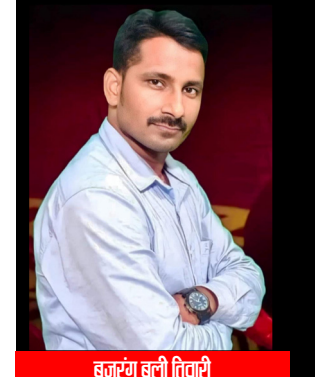
हत्याकांड की पीड़ित

पति का भी मिला लाश, हत्या या आत्महत्या?, जांच में जुटी वाराणसी कमिश्नरेंट पुलिस