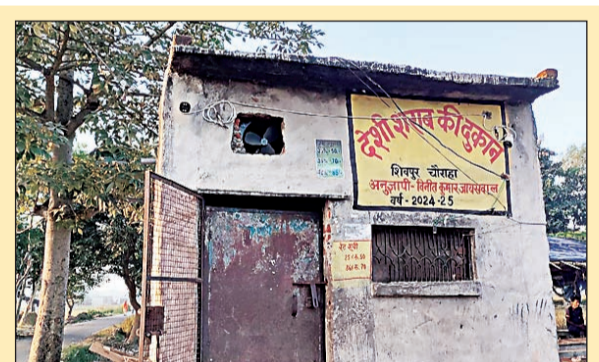
आबकारी अधिकारी का बयान संदेह के घेरे में

जिले में सरकारी शराब की दुकानों के खुलने व बंद होने का समय निर्धारित है वहीं जनपद के तहसील कैमियरगंज के ग्राम सभा शिवपुर गांव में संचालित देशी शराब की दुकान सुयोग्य के साथ ही खुल जाती है और ओवर रेट में शराब बिक्री की जाती है सुबह से शराबियों के जमावड़े लगने से आने जाने वाले ग्रामीणों और स्कूली छात्राओं एवं मंदिर जाने वाली महिलाओं को दिक्कत का सामना करना पड़ता है