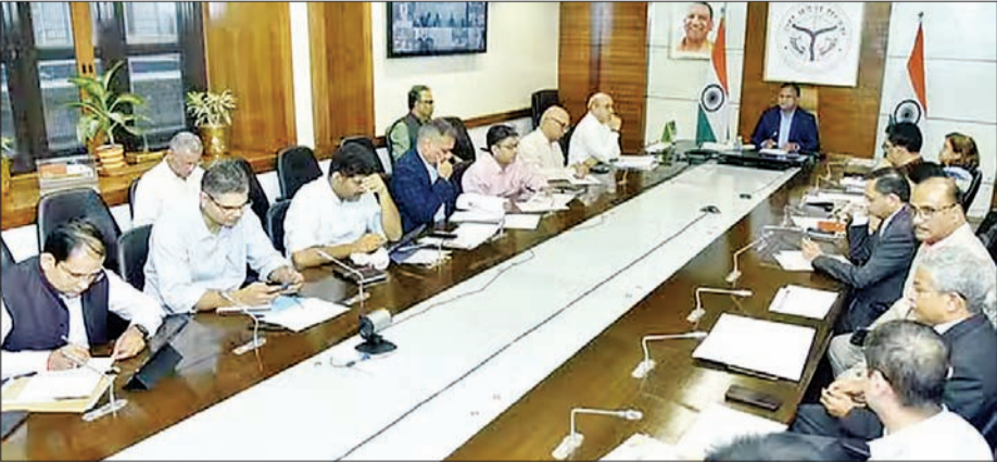
जन एक्सप्रेस | लखनऊ