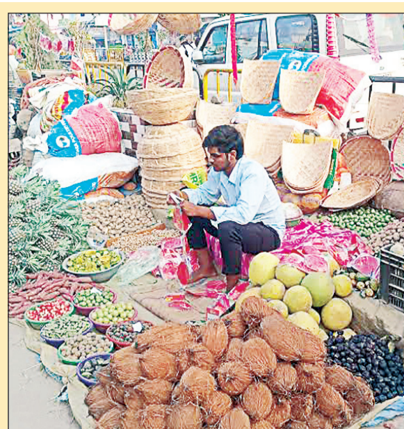
महंगे हुए बांस के सामान

शहर के विभिन्न मार्केटों पर शुक्रवार को खरीदारों की काफी भीड़ देखी गई। महानगर के गोलघर, घंटाघर, अलीनगर, असुरन, रासीनगर, बेतियाहाता, पांडेयहाता, विजय चौक, रूस्तमपुर, गोरखनाथ, मोहरीपुर आदि विभिन्न बाजारों में अधिकांश भीड़ रही।