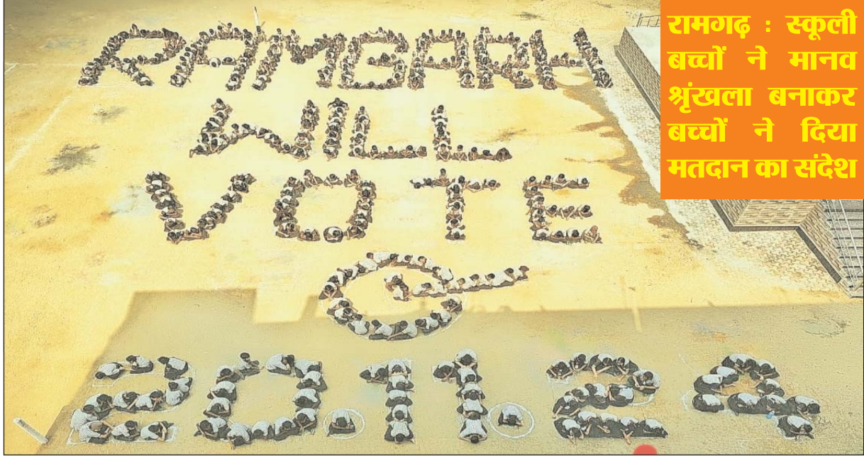
रामगढ़ : स्कूली बच्चों ने मानव श्रृंखला बनाकर बच्चों ने दिया मतदान का संदेश

खेर को आने वाली नेटफ्लिक्स रिलीज विजय 69 के लिए शुभकामनाएं देते हुए कहा कि वे चाहते हैं कि यह ग्लोबल हिट साबित हो। यह फिल्म यश राज फिल्मस एंटरटेनमेंट ने प्रोड्यूस की है और यह यश राज फिल्मस का नेटफ्लिक्स के साथ चौथा प्रोजेक्ट है। वे कहते हैं, विजय 69 अनुपम की कड़ी मेहनत और उनके अभिनय के जीनियस का प्रमाण है। 69 की उम्र में भी अनुपम काम के लिए उतने ही उत्साहित हैं, जितना एक नए अभिनेता के तौर पर रहते हैं। वे अनुशासित हैं, जीवन को पूरी तरह से जीते हैं, पढ़ने-लिखने में रुचि रखते हैं, मजाकिया हैं और एक सच्चे दोस्त भी हैं। अनिल और अनुपम सालों से दोस्त हैं और दोनों फिटनेस में गहरी रुचि रखते हैं।